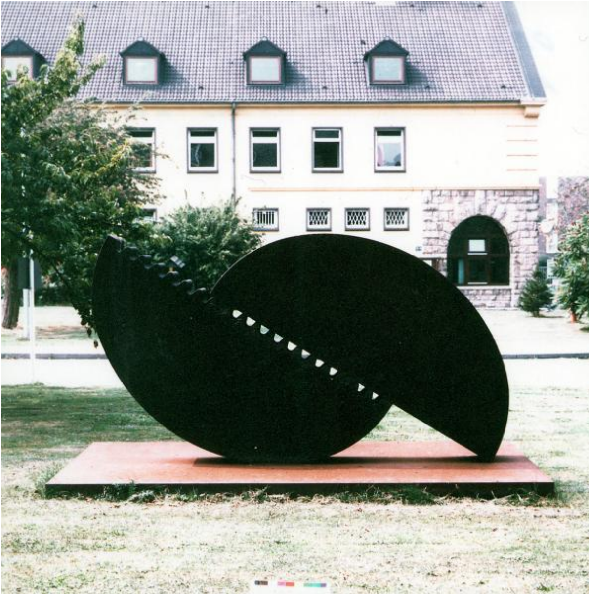
Wolfgang Nestler: Technik und Wissenschaft, 1979 / © Wolfgang Nestler; Fotonachweis: BBR / Archiv BMVg (1990)

Kunst am Bau im Auftrag des Bundes seit 1950