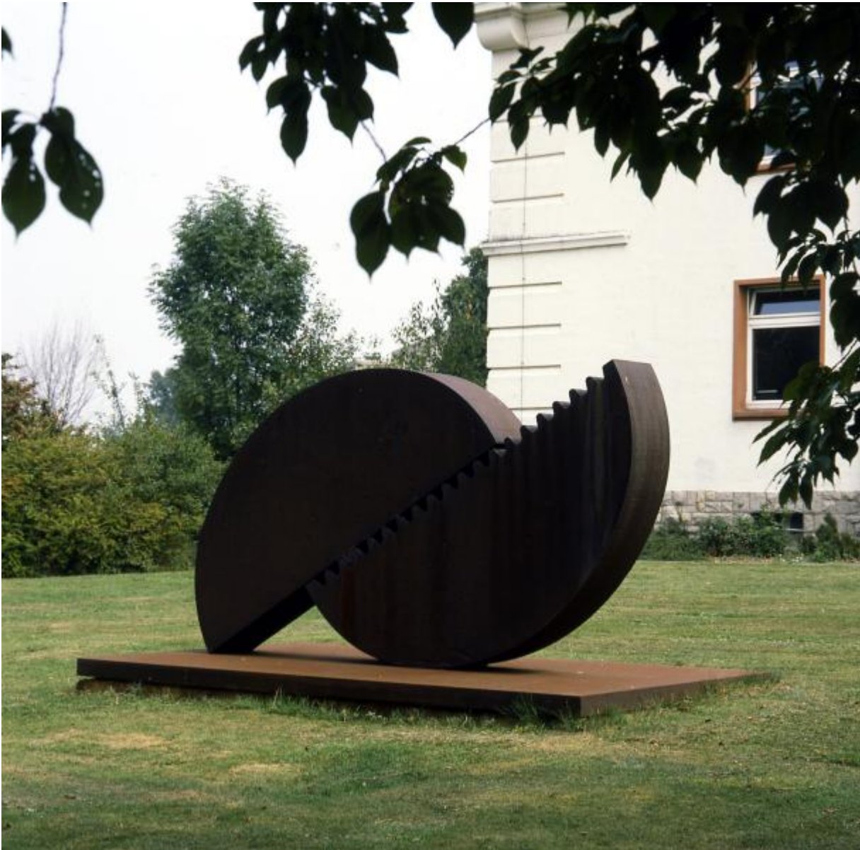
Wolfgang Nestler: Technik und Wissenschaft, 1979 / © Wolfgang Nestler

Kunst am Bau im Auftrag des Bundes seit 1950