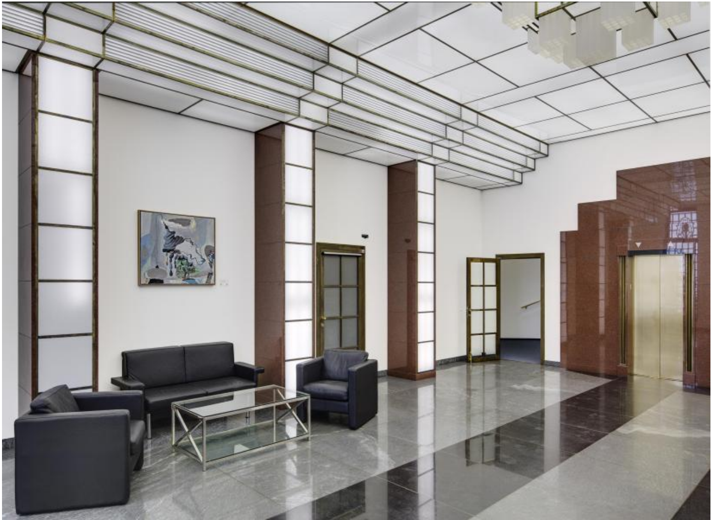
Peter Chevalier: Sternenruhe / Rest eines Traumes / K. im Glassaal, 2000 / © VG Bild-Kunst, Bonn; Fotonachweis: BBR / Cordia Schlegelmilch (2015)

Kunst am Bau im Auftrag des Bundes seit 1950