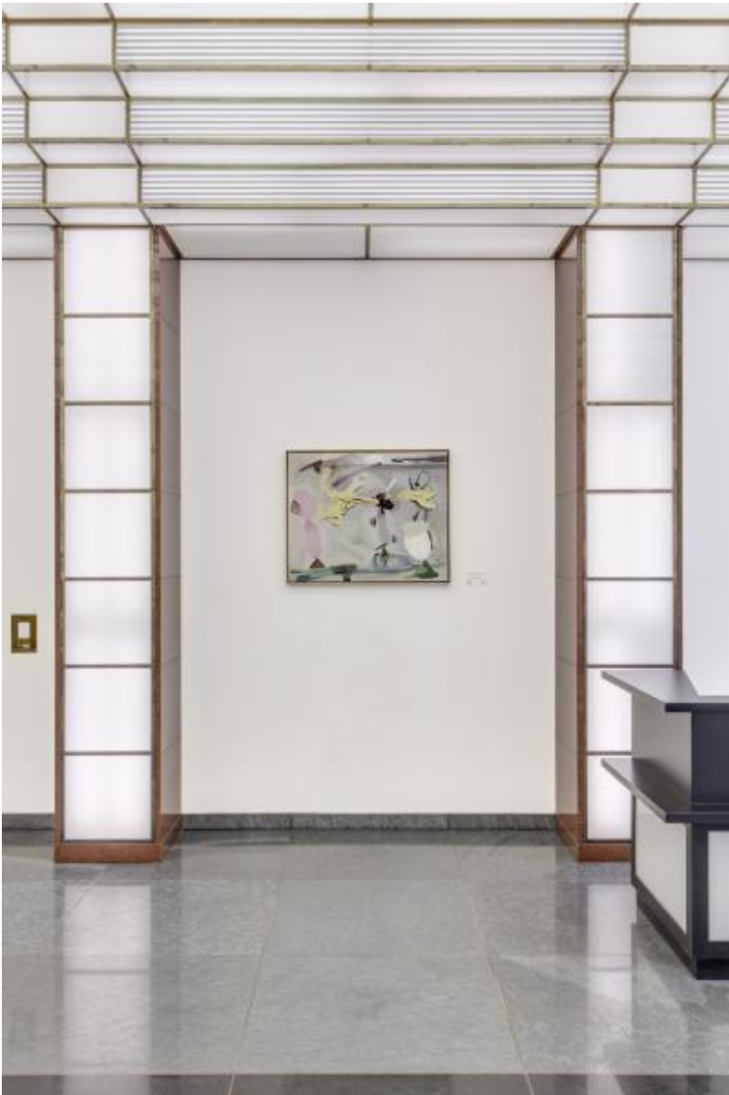
Peter Chevalier: Sternenruhe / Rest eines Traumes / K. im Glassaal, 2000 / © VG Bild-Kunst, Bonn; Fotonachweis: BBR / Cordia Schlegelmilch (2015)

Kunst am Bau im Auftrag des Bundes seit 1950