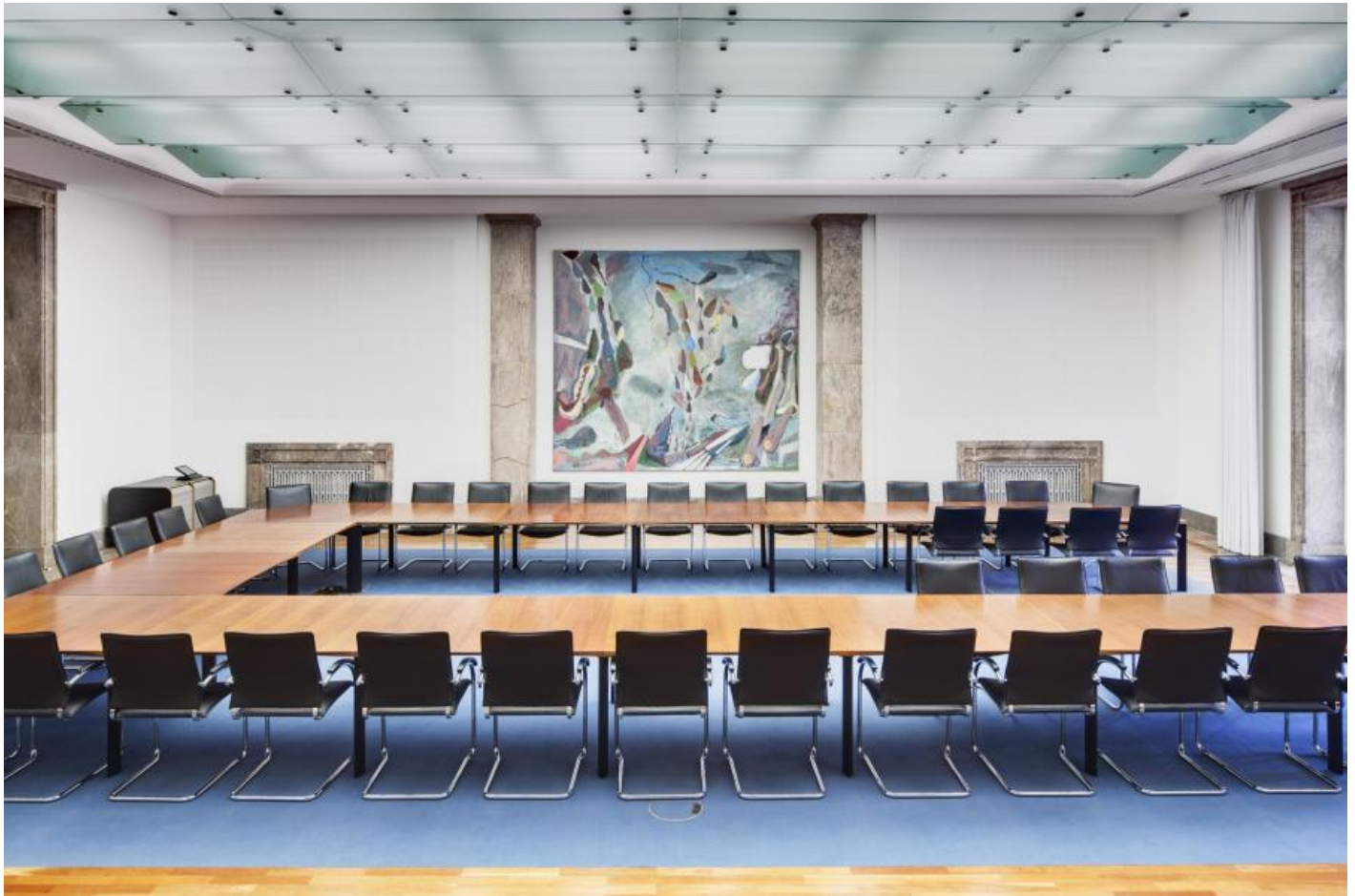
Peter Chevalier: Sternenruhe / Rest eines Traumes / K. im Glassaal, 2000 / © VG Bild-Kunst, Bonn; Fotonachweis: BBR / Cordia Schlegelmilch (2015)