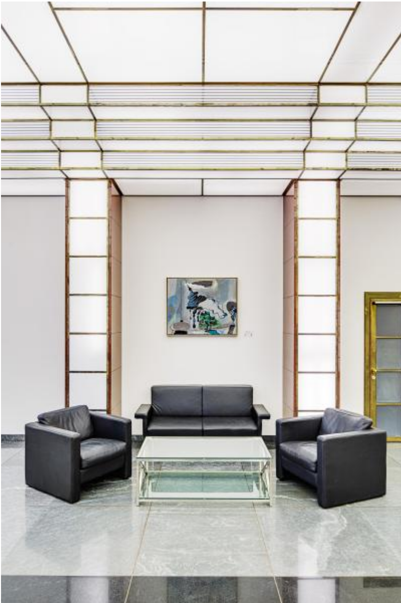
Peter Chevalier: Sternenruhe / Rest eines Traumes / K. im Glassaal, 2000 / © VG Bild-Kunst, Bonn; Fotonachweis: BBR / Cordia Schlegelmilch

Kunst am Bau im Auftrag des Bundes seit 1950