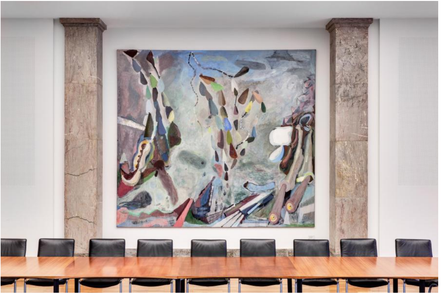
Peter Chevalier: Sternenruhe / Rest eines Traumes / K. im Glassaal, 2000 / © VG Bild-Kunst, Bonn

Kunst am Bau im Auftrag des Bundes seit 1950