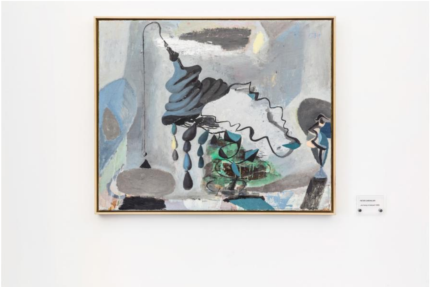
Peter Chevalier: Sternenruhe / Rest eines Traumes / K. im Glassaal, 2000 / © VG Bild-Kunst, Bonn; Fotonachweis: BBR / Cordia Schlegelmilch (2015)

Kunst am Bau im Auftrag des Bundes seit 1950