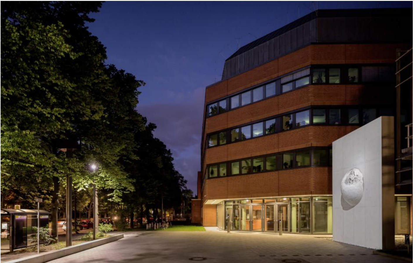
Egill Saebjörnsson: Steinkugel, 2014 / © Egill Saebjörnsson

Kunst am Bau im Auftrag des Bundes seit 1950