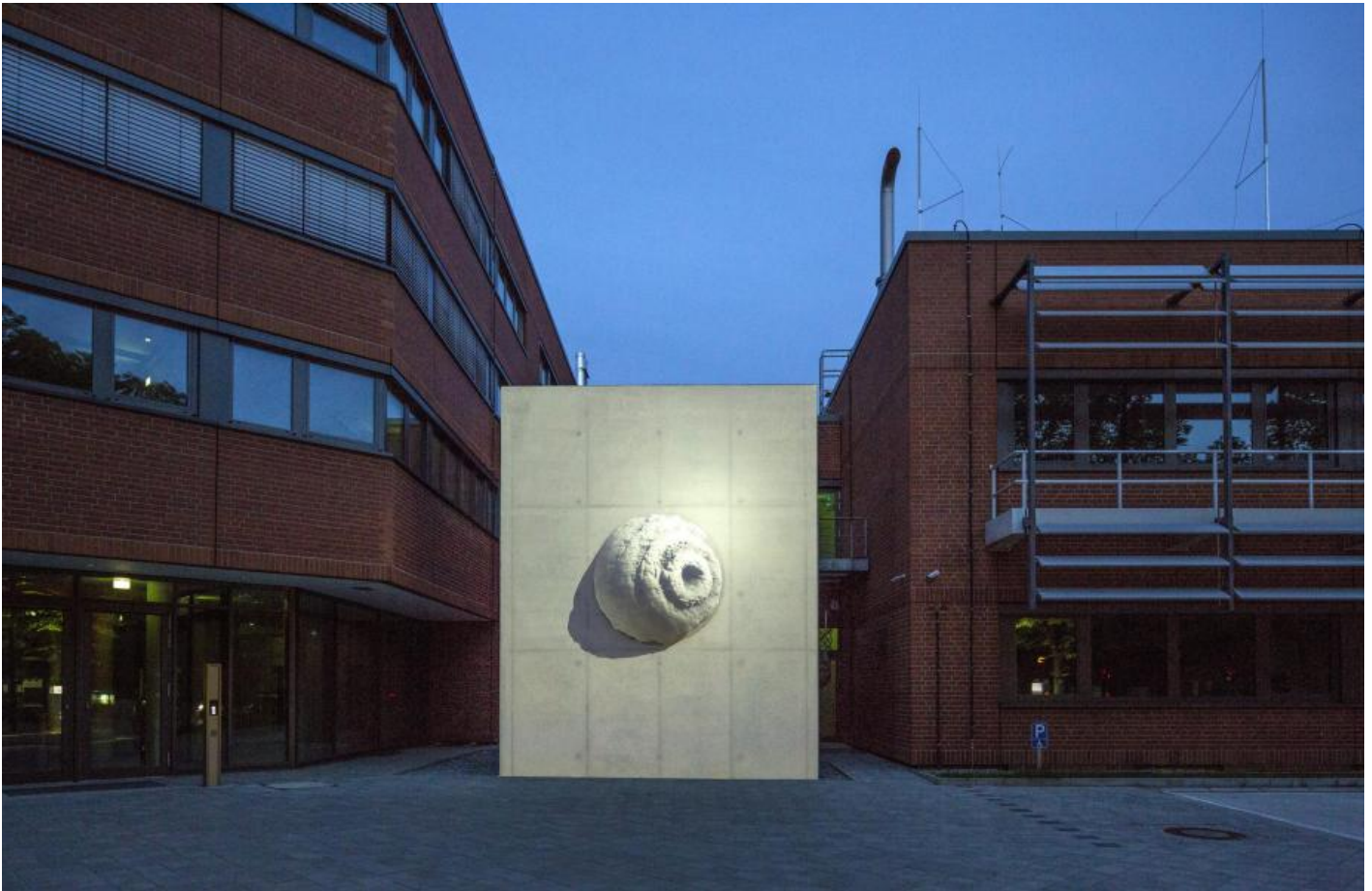
Egill Saebjörnsson: Steinkugel, 2014 / © Egill Saebjörnsson

Kunst am Bau im Auftrag des Bundes seit 1950