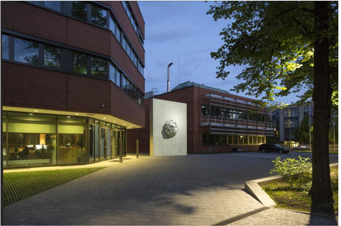
Egill Saebjörnsson: Steinkugel, 2014 / © Egill Saebjörnsson; Fotonachweis: BBR / Cordia Schlegelmilch

Kunst am Bau im Auftrag des Bundes seit 1950