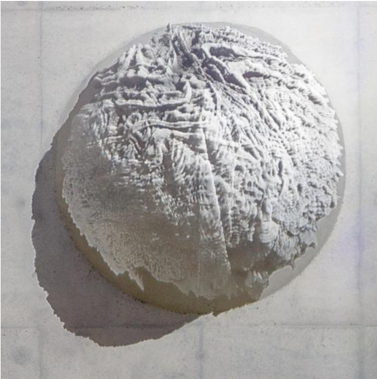
Egill Saebjörnsson: Steinkugel, 2014 / © Egill Saebjörnsson

Kunst am Bau im Auftrag des Bundes seit 1950