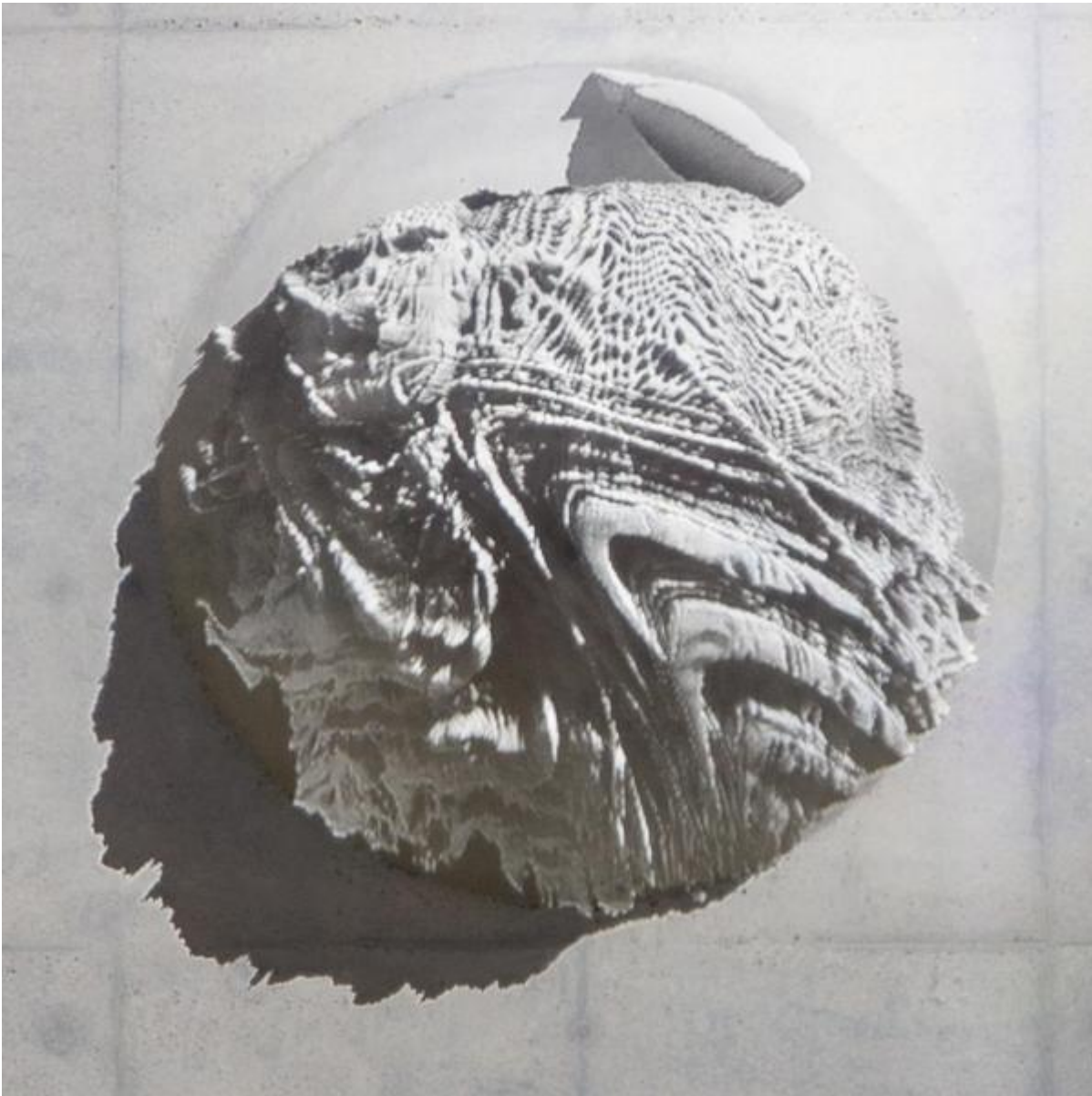
Egill Saebjörnsson: Steinkugel, 2014 / © Egill Saebjörnsson; Fotonachweis: BBR / Cordia Schlegelmilch

Kunst am Bau im Auftrag des Bundes seit 1950