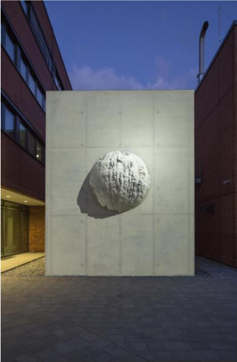
Egill Saebjörnsson: Steinkugel, 2014 / © Egill Saebjörnsson