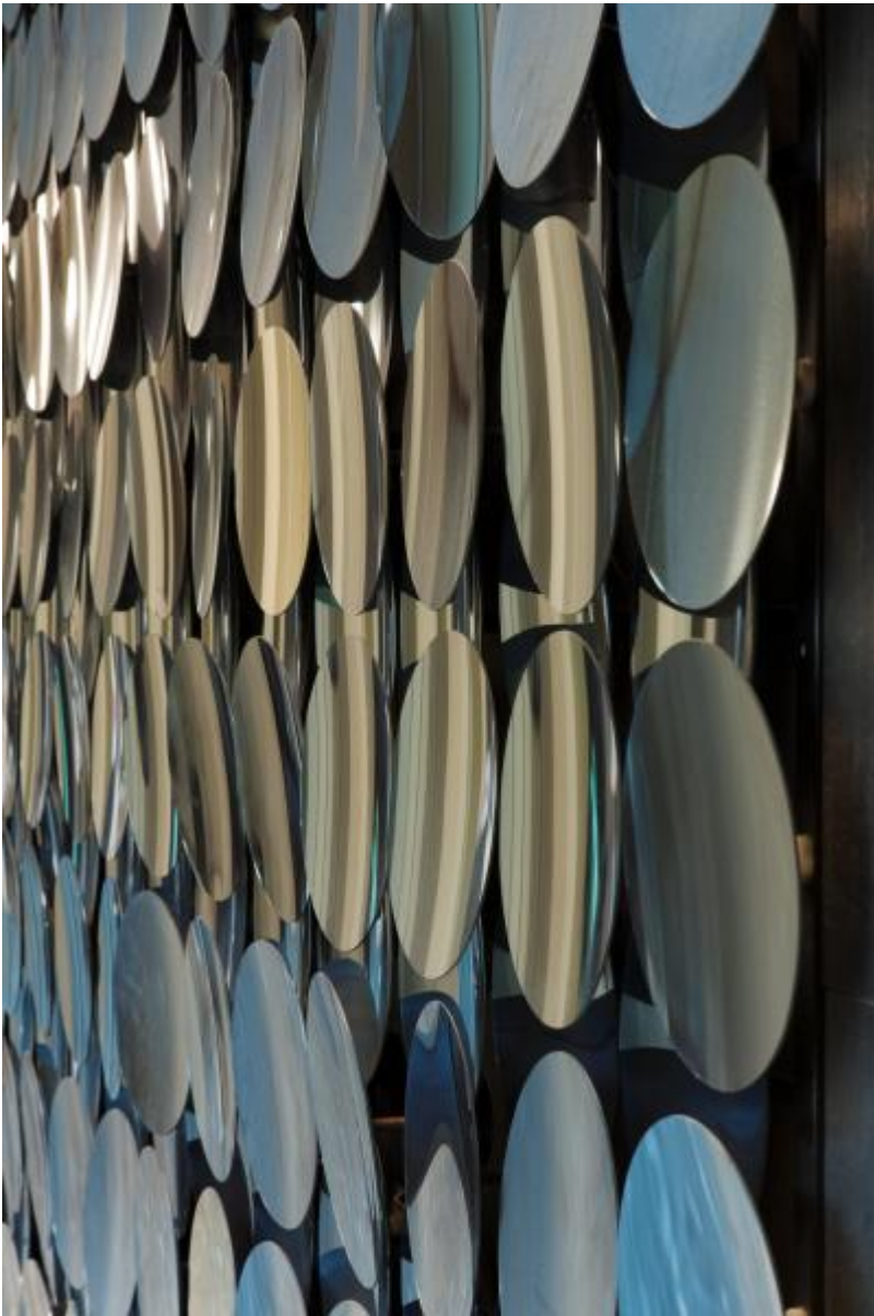
Adolf Luther: Spiegelwand, 1973 / © VG Bild-Kunst, Bonn

Kunst am Bau im Auftrag des Bundes seit 1950