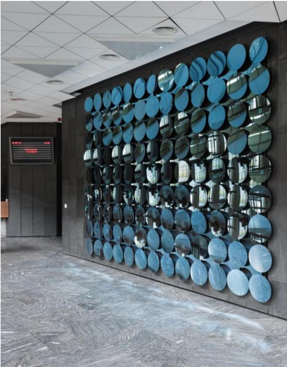
Adolf Luther: Spiegelwand, 1973 / © VG Bild-Kunst, Bonn; Fotonachweis: BBR / Bernd Hiepe (2012)

Kunst am Bau im Auftrag des Bundes seit 1950