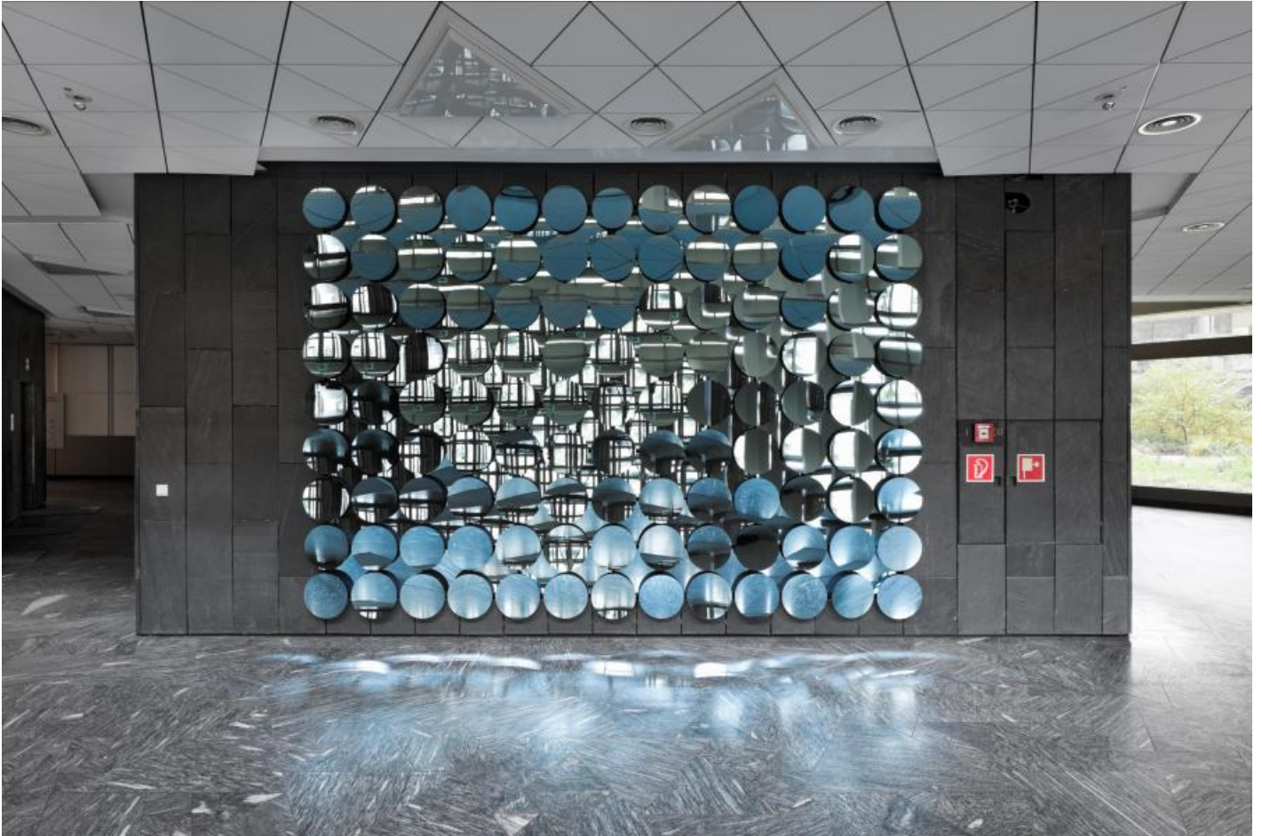
Adolf Luther: Spiegelwand, 1973 / © VG Bild-Kunst, Bonn; Fotonachweis: BBR / Bernd Hiepe (2012)