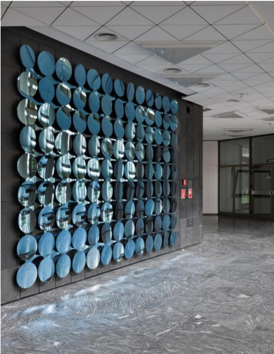
Adolf Luther: Spiegelwand, 1973 / © VG Bild-Kunst, Bonn; Fotonachweis: BBR / Bernd Hiepe (2012)

Kunst am Bau im Auftrag des Bundes seit 1950