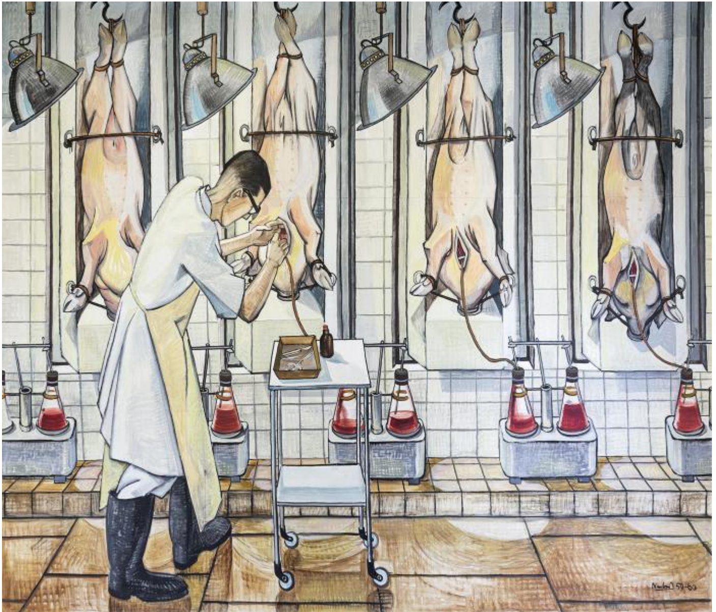
Hans Neubert: Sinn und Praxis der Virologie, 1960