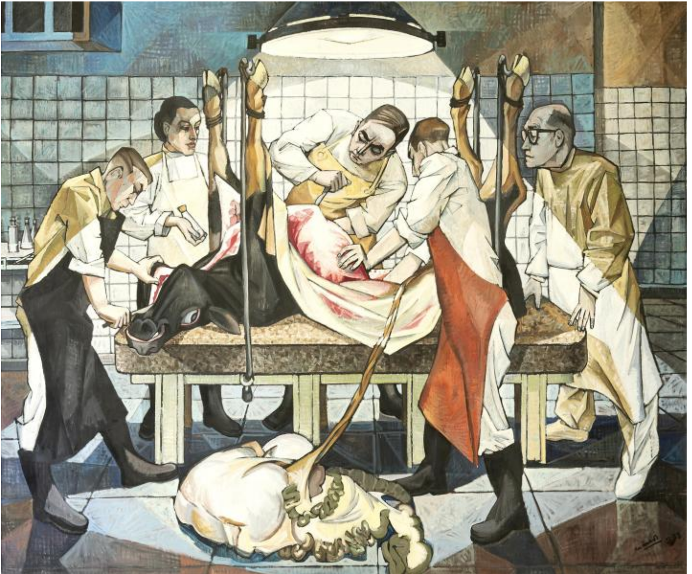
Hans Neubert: Sinn und Praxis der Virologie, 1960

Kunst am Bau im Auftrag des Bundes seit 1950