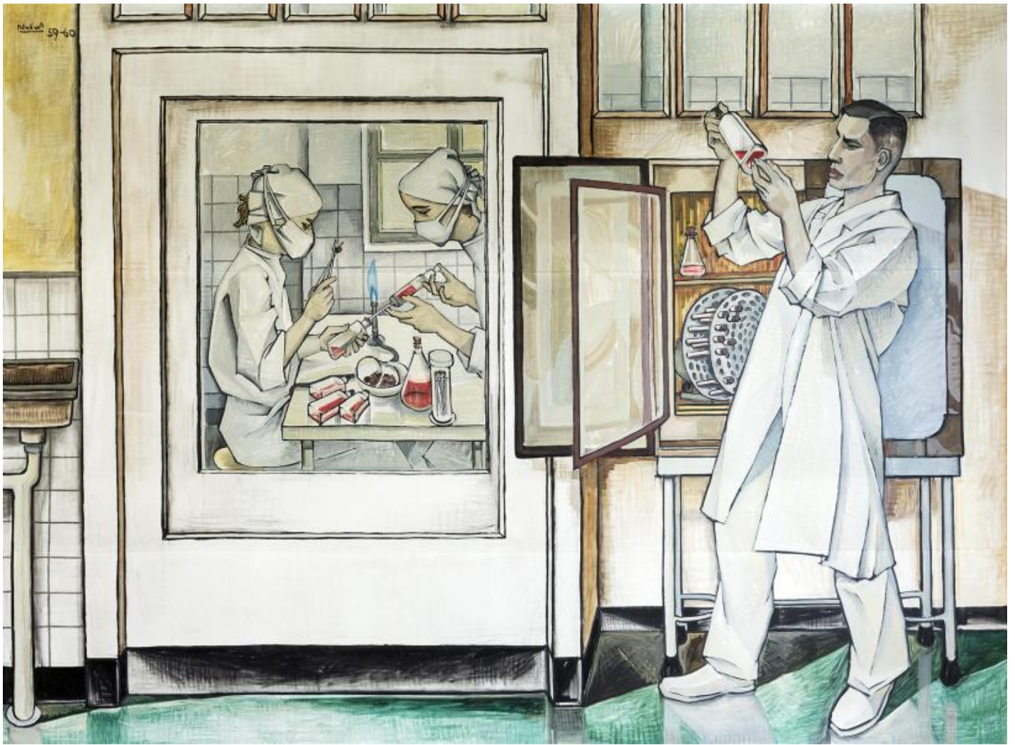
Hans Neubert: Sinn und Praxis der Virologie, 1960 / Fotonachweis: FLI / Mandy Jörn (2020)

Kunst am Bau im Auftrag des Bundes seit 1950