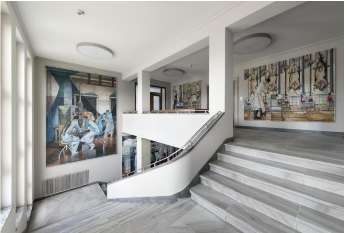
Hans Neubert: Sinn und Praxis der Virologie, 1960

Kunst am Bau im Auftrag des Bundes seit 1950