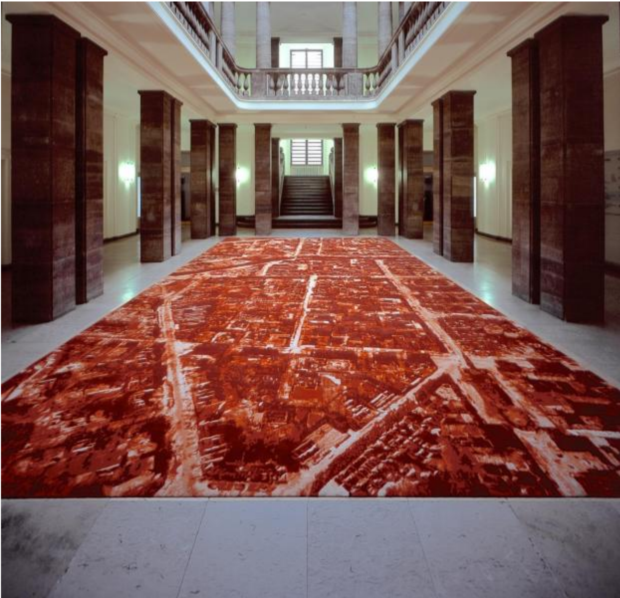
Via Lewandowsky: Roter Teppich, 2003 / © VG Bild-Kunst, Bonn