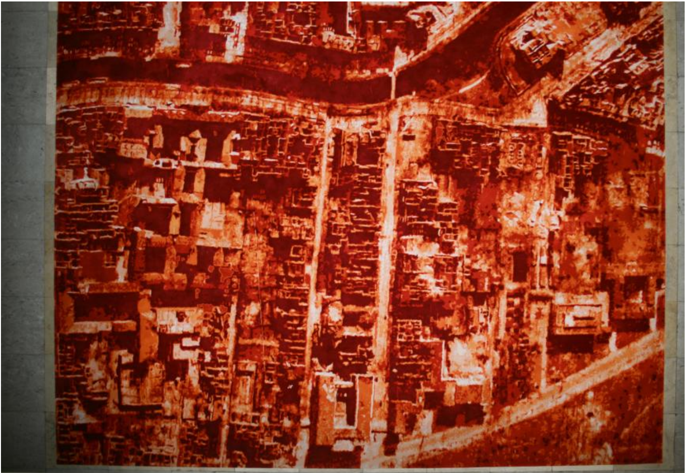
Via Lewandowsky: Roter Teppich, 2003 / © VG Bild-Kunst, Bonn; Fotonachweis: BBR / Martin Seidel (2007)

Kunst am Bau im Auftrag des Bundes seit 1950