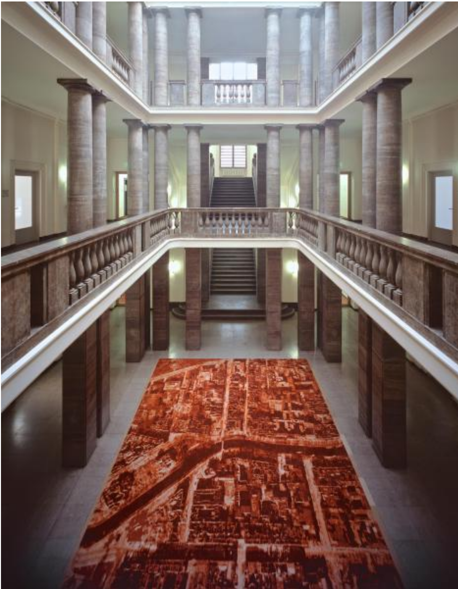
Via Lewandowsky: Roter Teppich, 2003 / © VG Bild-Kunst, Bonn; Fotonachweis: BBR / Volker Kreidler (2003)

Kunst am Bau im Auftrag des Bundes seit 1950