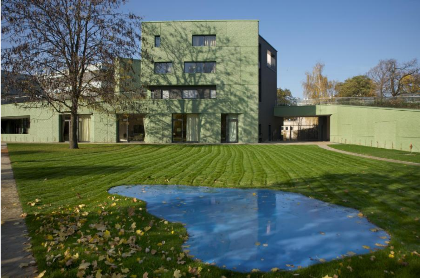
Rainer Splitt: Reflecting Pool, 2007 / © VG Bild-Kunst, Bonn