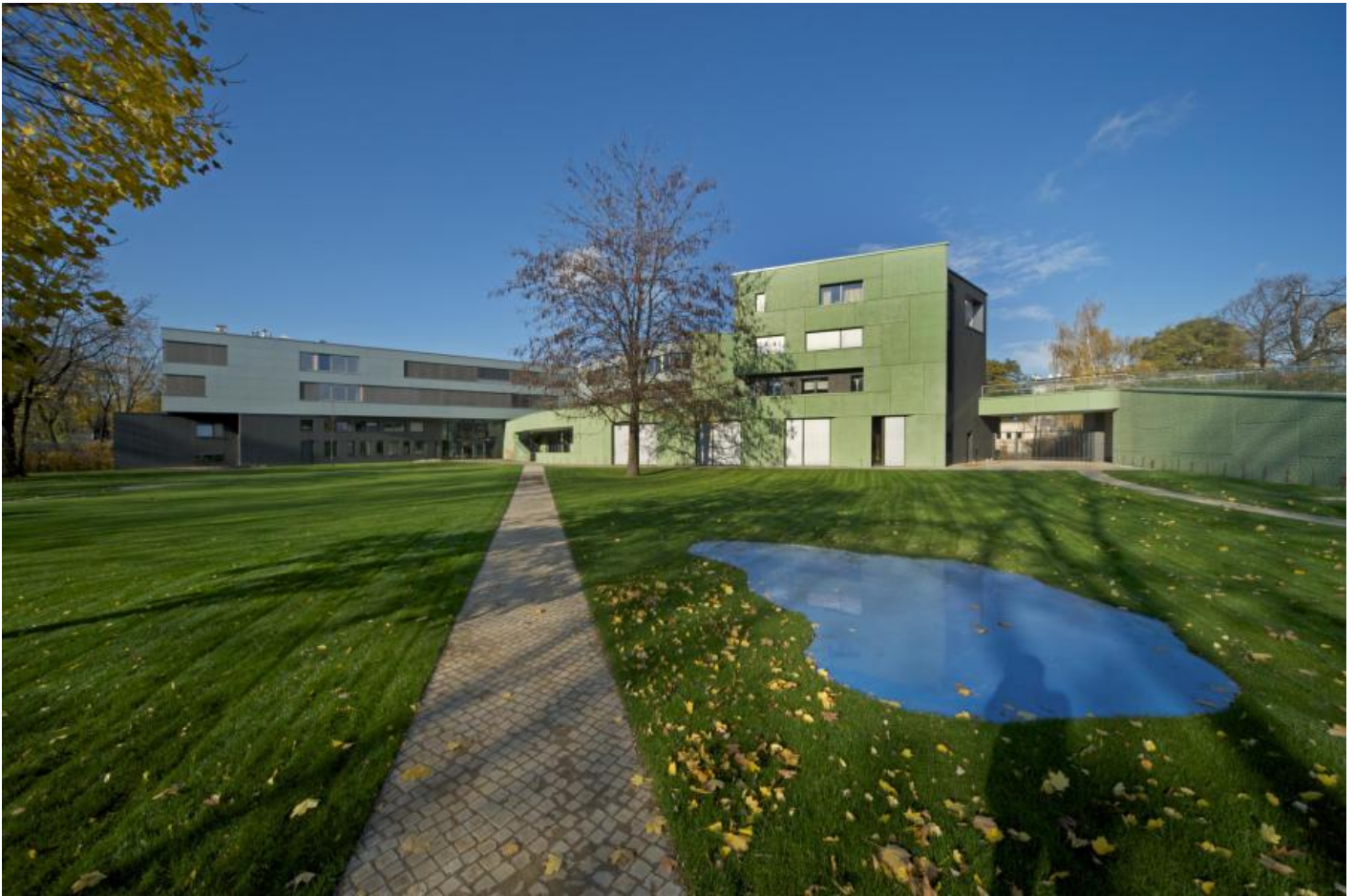
Rainer Splitt: Reflecting Pool, 2007 / © VG Bild-Kunst, Bonn; Fotonachweis: BBR / Hanns Joosten (2008)

Kunst am Bau im Auftrag des Bundes seit 1950