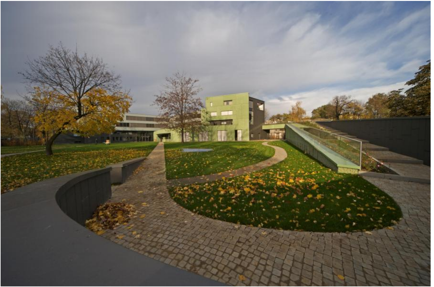
Rainer Splitt: Reflecting Pool, 2007 / © VG Bild-Kunst, Bonn; Fotonachweis: BBR / Hanns Joosten (2008)

Kunst am Bau im Auftrag des Bundes seit 1950