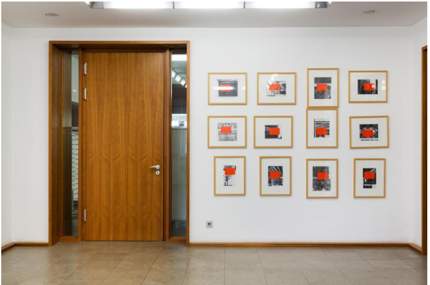
Thom Barth: Raster D, 2000 / © VG Bild-Kunst, Bonn; Fotonachweis: BBR / Cordia Schlegelmilch

Kunst am Bau im Auftrag des Bundes seit 1950