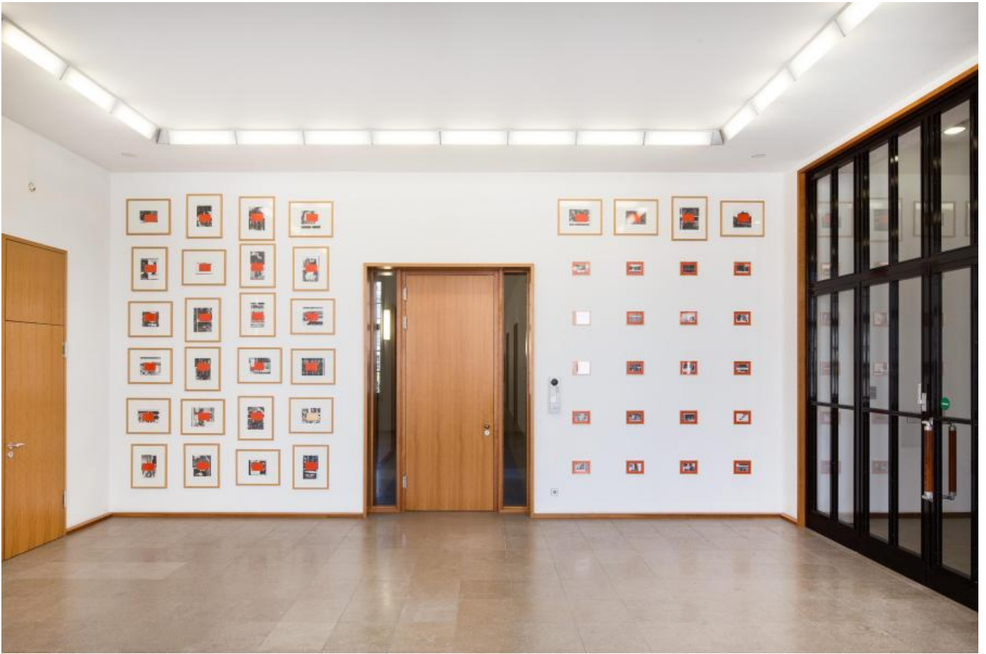
Thom Barth: Raster D, 2000 / © VG Bild-Kunst, Bonn; Fotonachweis: BBR / Cordia Schlegelmilch (2015)

Kunst am Bau im Auftrag des Bundes seit 1950