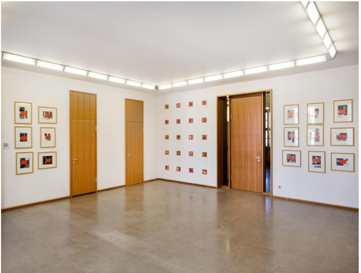
Thom Barth: Raster D, 2000 / © VG Bild-Kunst, Bonn; Fotonachweis: BBR / Cordia Schlegelmilch (2015)

Kunst am Bau im Auftrag des Bundes seit 1950