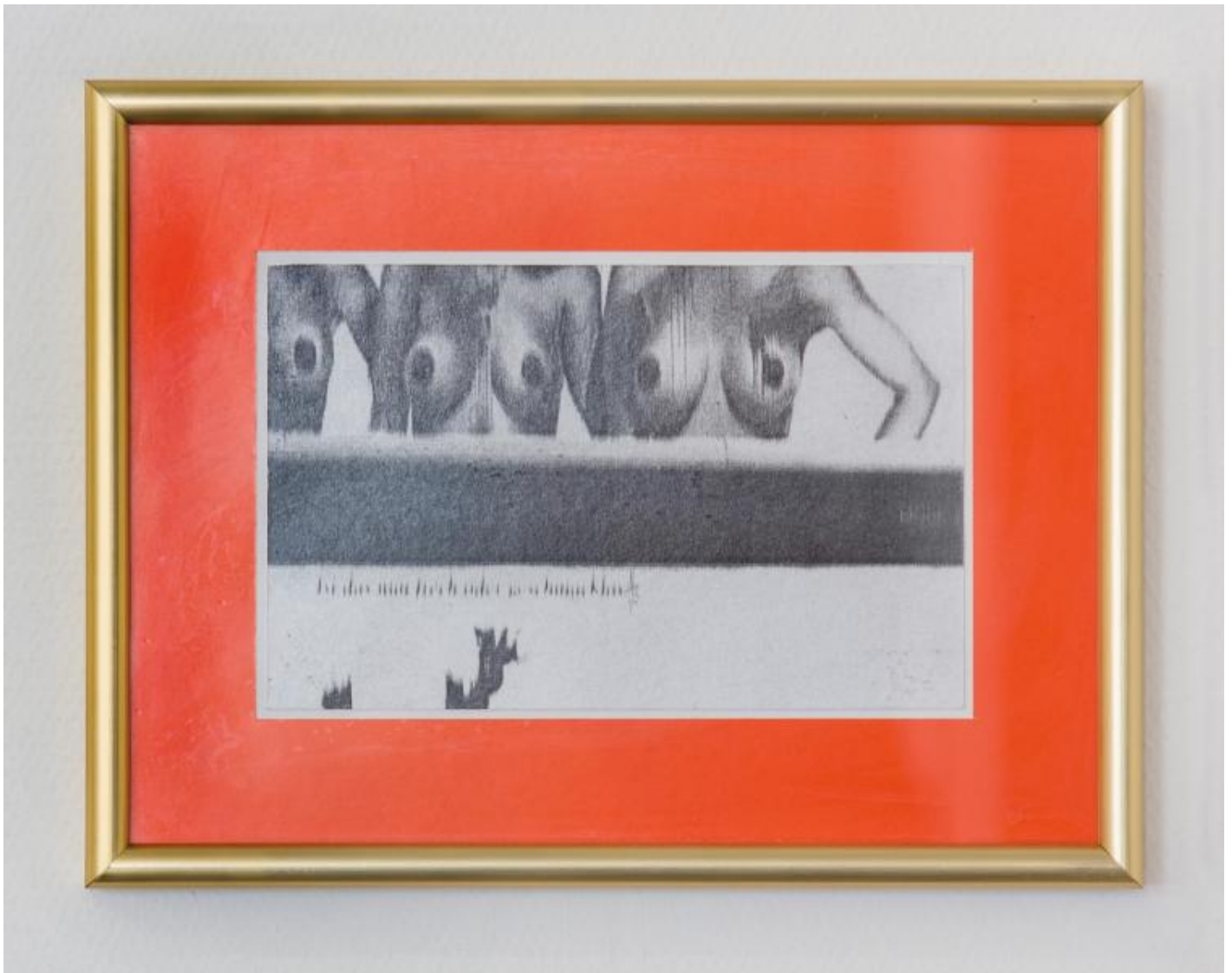
Thom Barth: Raster D, 2000 / © VG Bild-Kunst, Bonn; Fotonachweis: BBR / Cordia Schlegelmilch (2015)

Kunst am Bau im Auftrag des Bundes seit 1950