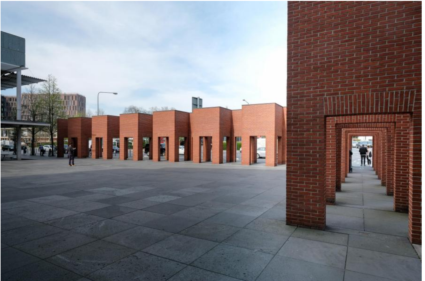
Per Kirkeby: Ohne Titel (Skulpturale Architektur) , 1996 / © Per Kirkeby