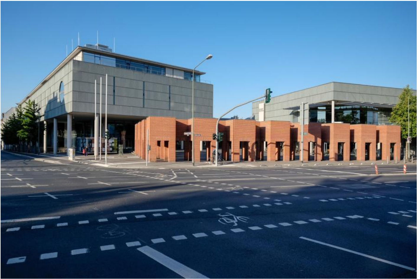
Per Kirkeby: Ohne Titel (Skulpturale Architektur) , 1996 / © Per Kirkeby

Kunst am Bau im Auftrag des Bundes seit 1950