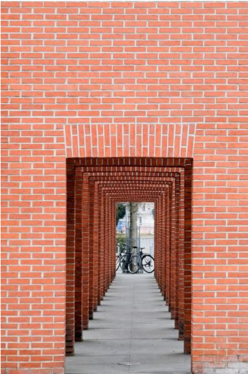
Per Kirkeby: Ohne Titel (Skulpturale Architektur) , 1996 / © Per Kirkeby; Fotonachweis: DNB / Stephan Jockel (2017)

Kunst am Bau im Auftrag des Bundes seit 1950