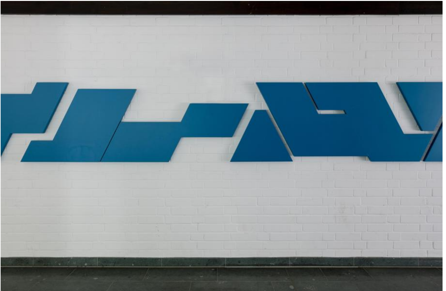
Christian Roeckenschuss: o. T. (Wandrelief), 1977 / © Christian Roeckenschuss; Fotonachweis: BBR / Cordia Schlegelmilch (2017)

Kunst am Bau im Auftrag des Bundes seit 1950