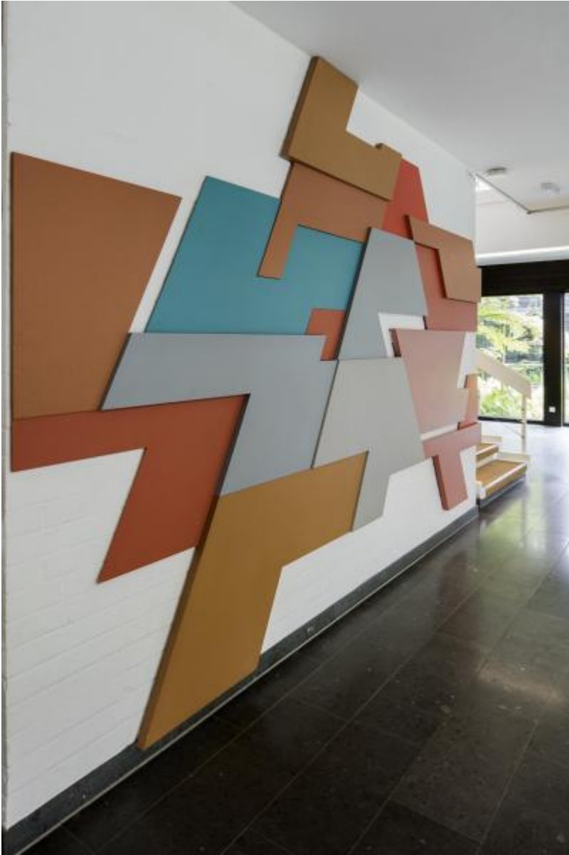
Christian Roeckenschuss: o. T. (Wandreif), 1977 / © Christian Roeckenschuss