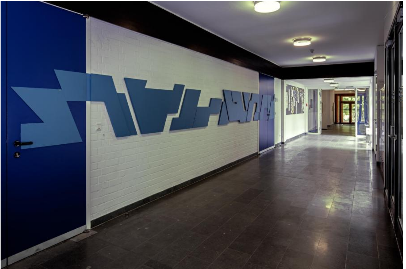
Christian Roeckenschuss: o. T. (Wandrelief), 1977 / © Christian Roeckenschuss; Fotonachweis: BBR / Cordia Schlegelmilch (2017)

Kunst am Bau im Auftrag des Bundes seit 1950