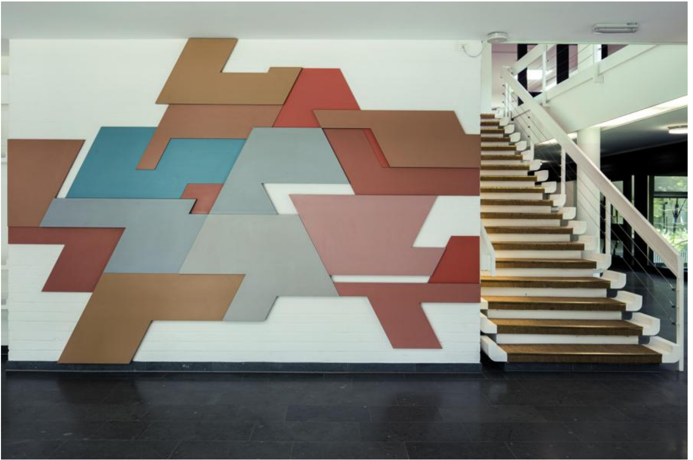
Christian Roeckenschuss: o. T. (Wandrelief), 1977 / © Christian Roeckenschuss; Fotonachweis: BBR / Cordia Schlegelmilch (2017)

Kunst am Bau im Auftrag des Bundes seit 1950