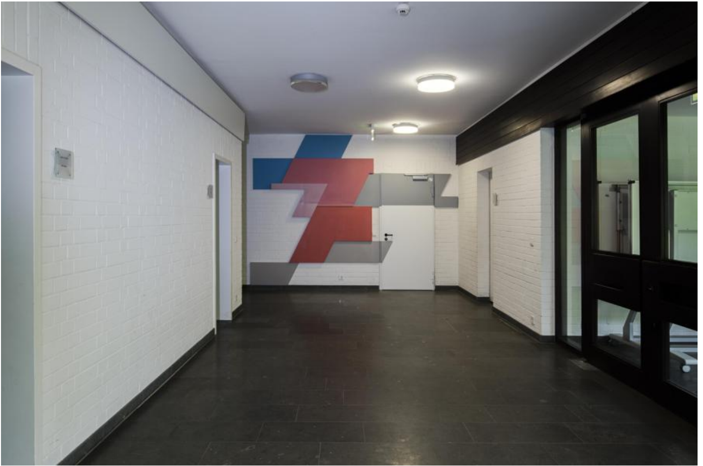
Christian Roeckenschuss: o. T. (Wandrelief), 1977 / © Christian Roeckenschuss

Kunst am Bau im Auftrag des Bundes seit 1950