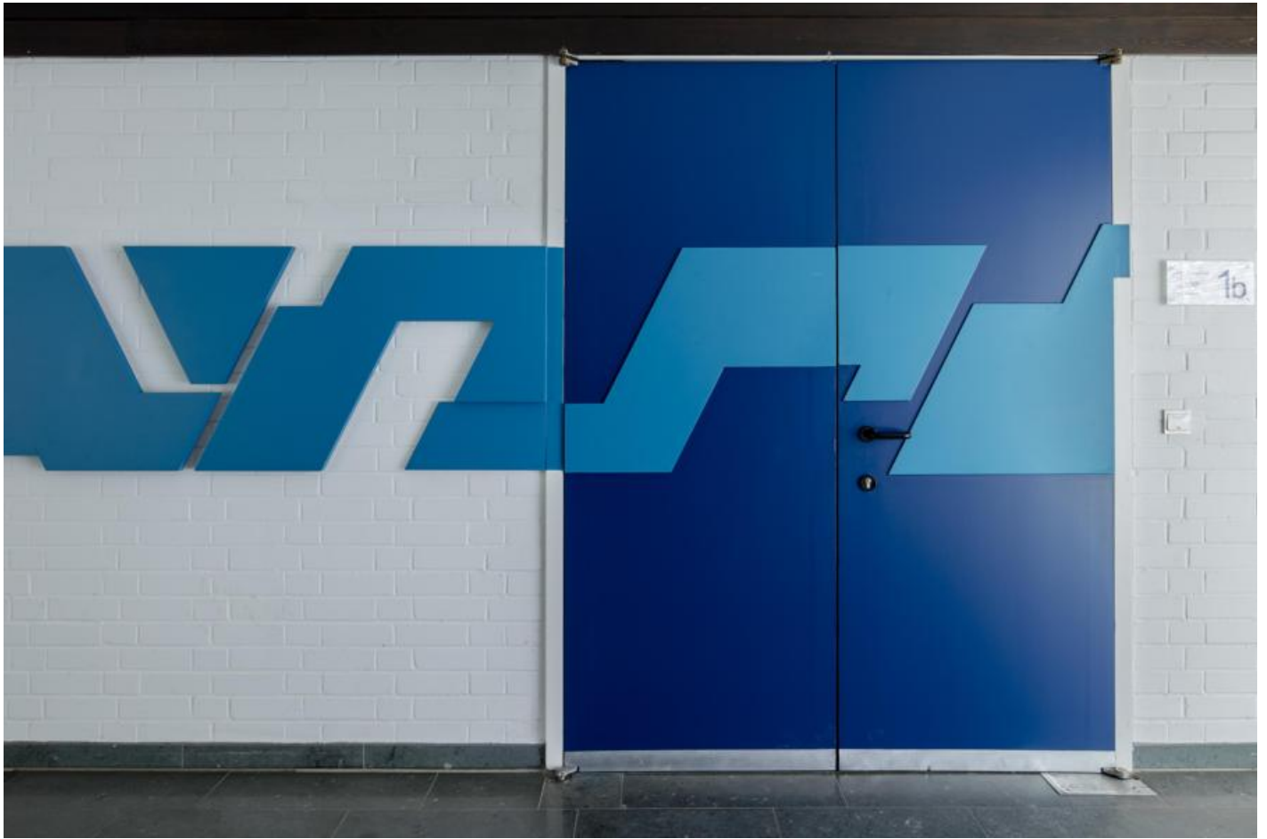
Christian Roeckenschuss: o. T. (Wandrelief), 1977 / © Christian Roeckenschuss; Fotonachweis: BBR / Cordia Schlegelmilch (2017)

Kunst am Bau im Auftrag des Bundes seit 1950