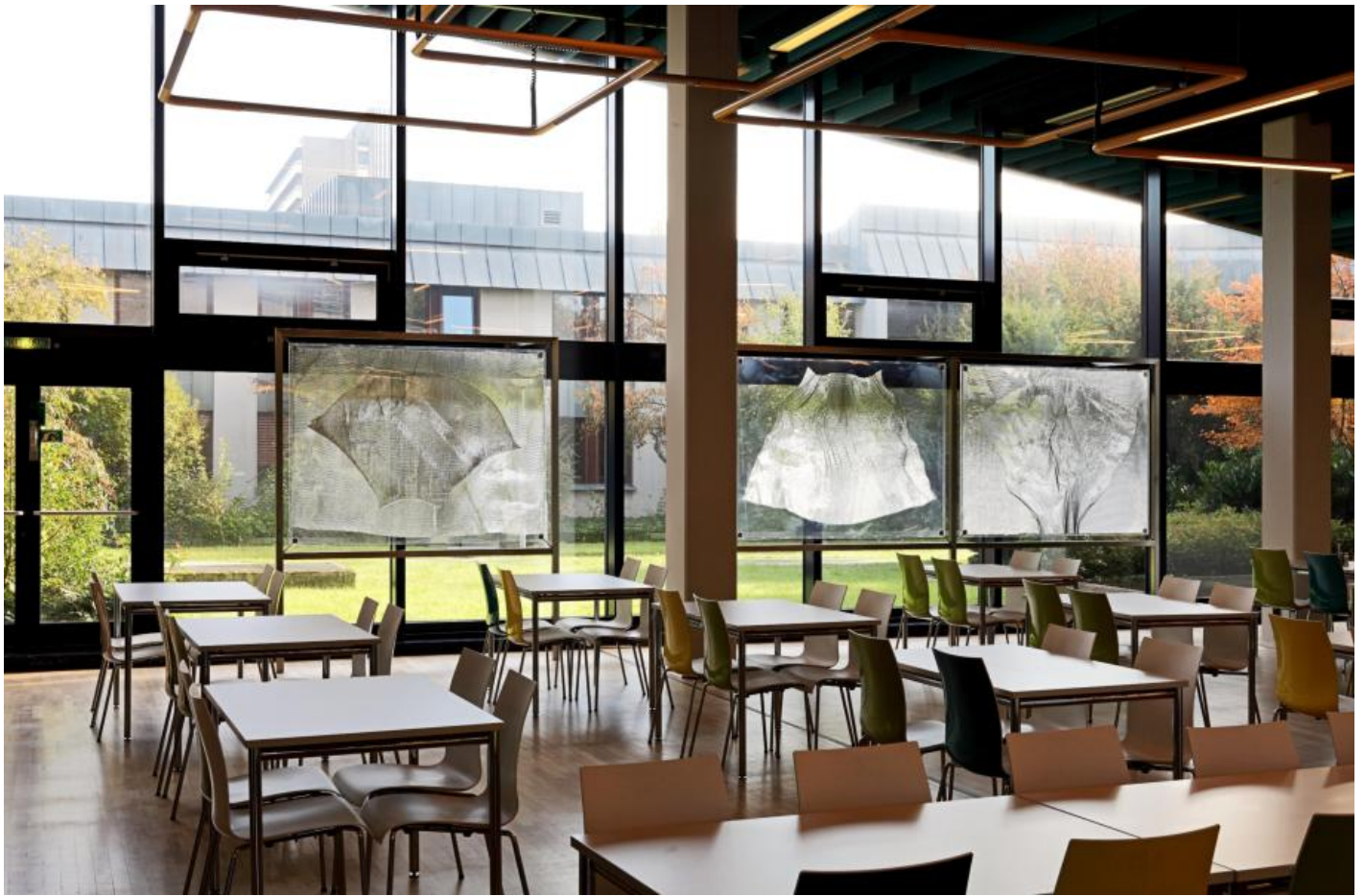
Heinz Mack: o. T. (Drei Fenster-Flügel), 1979 / © VG Bild-Kunst, Bonn; Fotonachweis: BBR / Cordia Schlegelmilch (2013)

Kunst am Bau im Auftrag des Bundes seit 1950