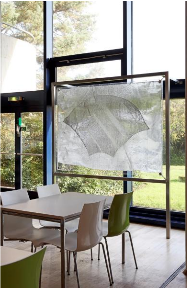
Heinz Mack: o. T. (Drei Fenster-Flügel), 1979 / © VG Bild-Kunst, Bonn; Fotonachweis: BBR / Cordia Schlegelmilch (2013)

Kunst am Bau im Auftrag des Bundes seit 1950