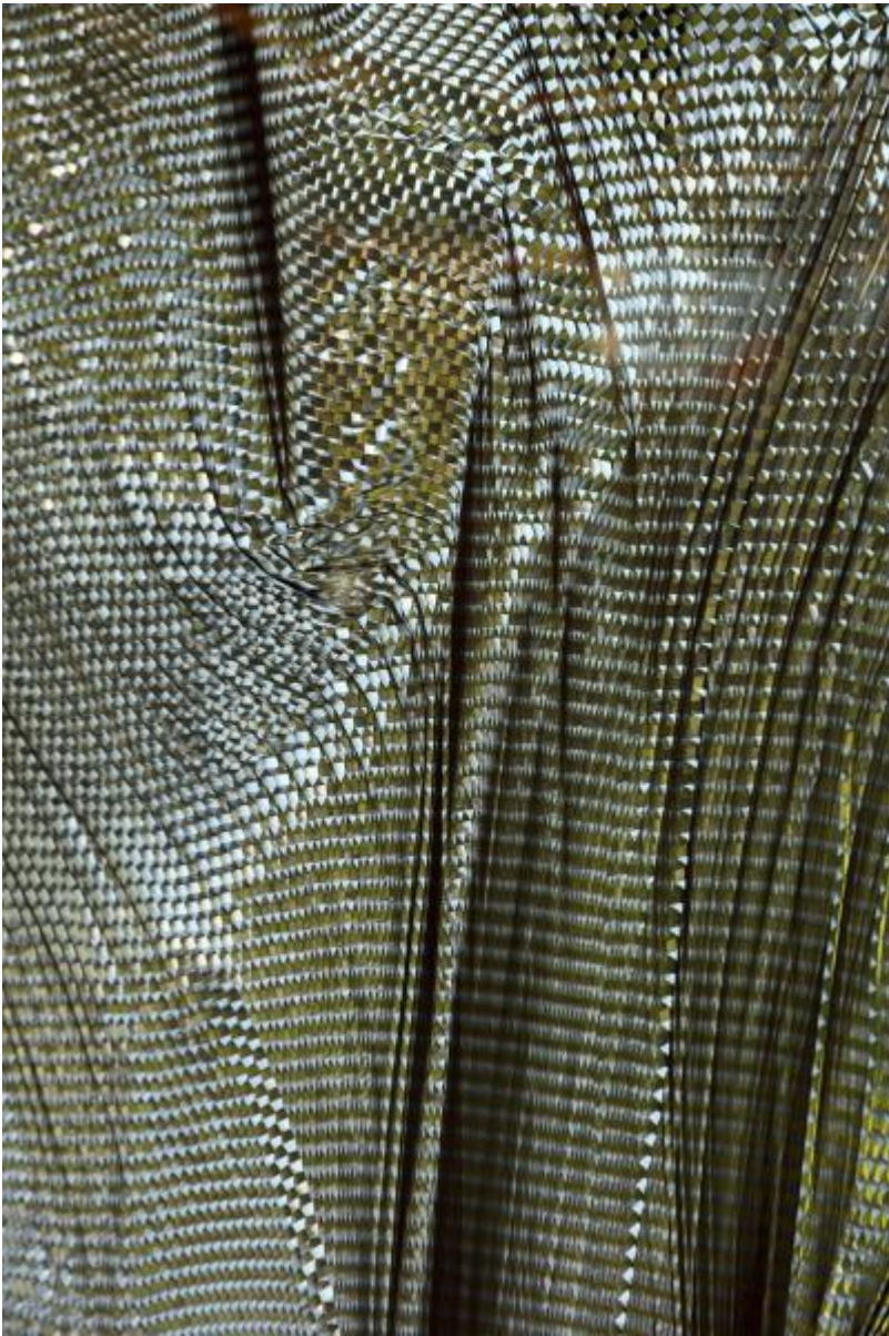
Heinz Mack: o. T. (Drei Fenster-Flügel), 1979 / © VG Bild-Kunst, Bonn

Kunst am Bau im Auftrag des Bundes seit 1950