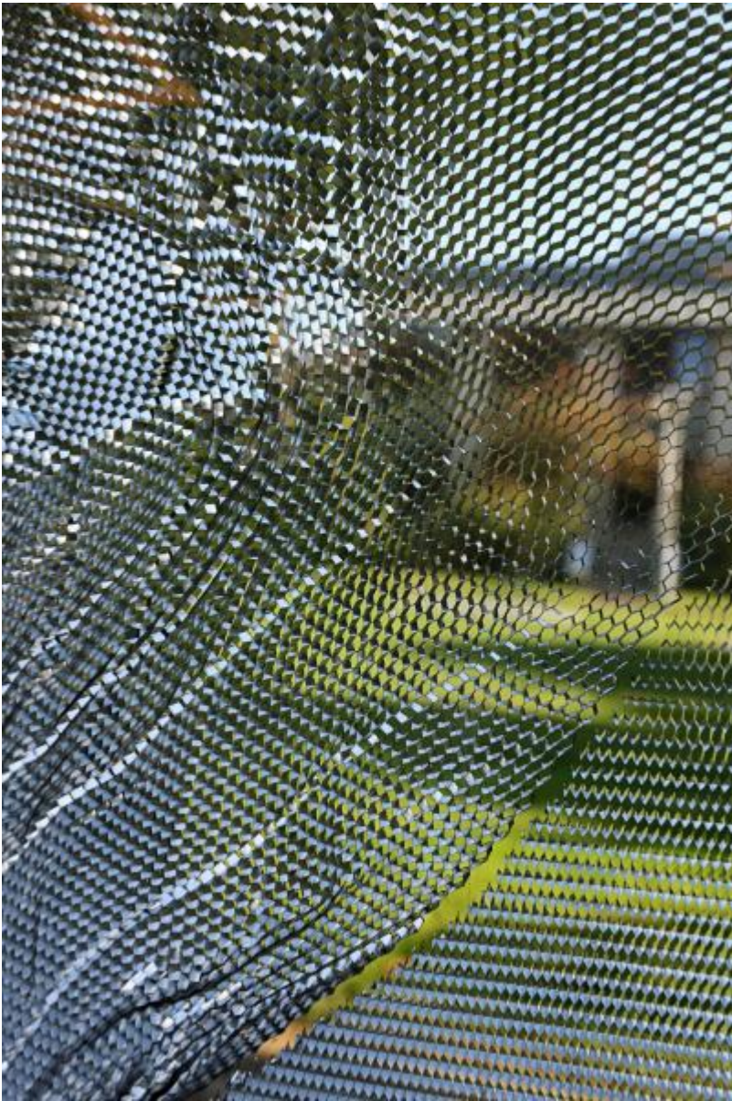
Heinz Mack: o. T. (Drei Fenster-Flügel), 1979 / © VG Bild-Kunst, Bonn; Fotonachweis: BBR / Cordia Schlegelmilch (2013)

Kunst am Bau im Auftrag des Bundes seit 1950