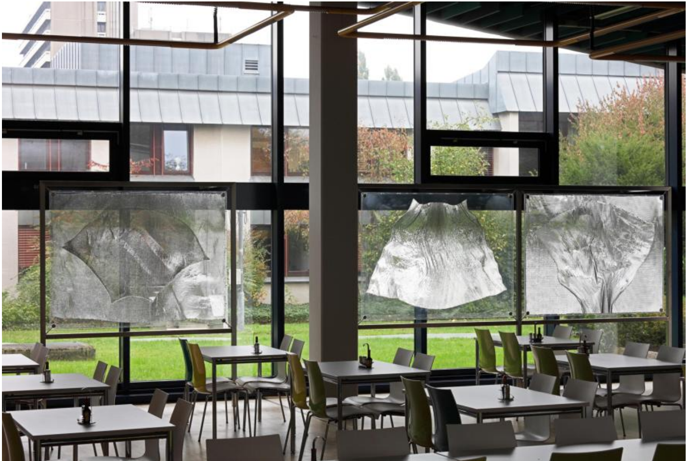
Heinz Mack: o. T. (Drei Fenster-Flügel), 1979 / © VG Bild-Kunst, Bonn