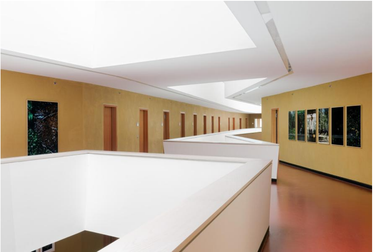
Frank Stürmer: o. T. (Bayerischer Wald I-VII), 2011 / © Frank Stürmer; Fotonachweis: BBR / Bernd Hiepe (2011)

Kunst am Bau im Auftrag des Bundes seit 1950