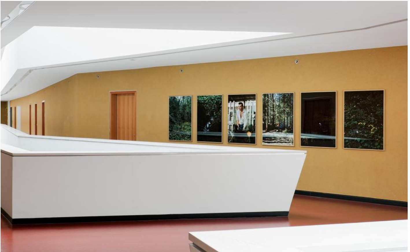
Frank Stürmer: o. T. (Bayerischer Wald I-VII), 2011 / © Frank Stürmer; Fotonachweis: BBR / Bernd Hiepe (2011)

Kunst am Bau im Auftrag des Bundes seit 1950