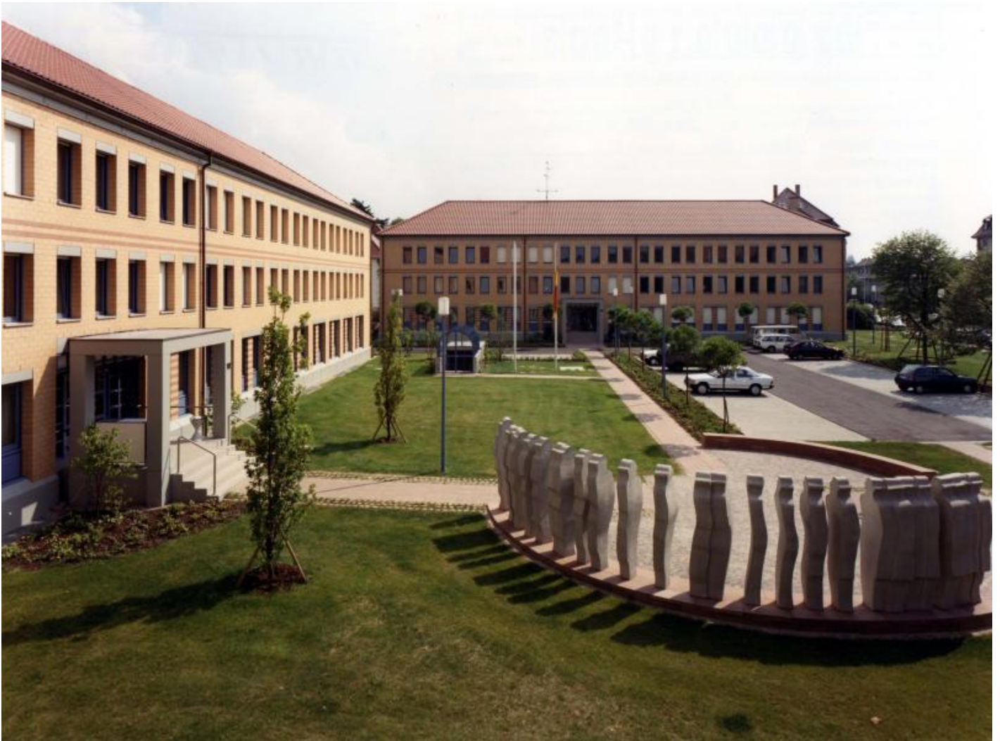
Rainer Stiefvater: Metamorphose, 1987

Kunst am Bau im Auftrag des Bundes seit 1950