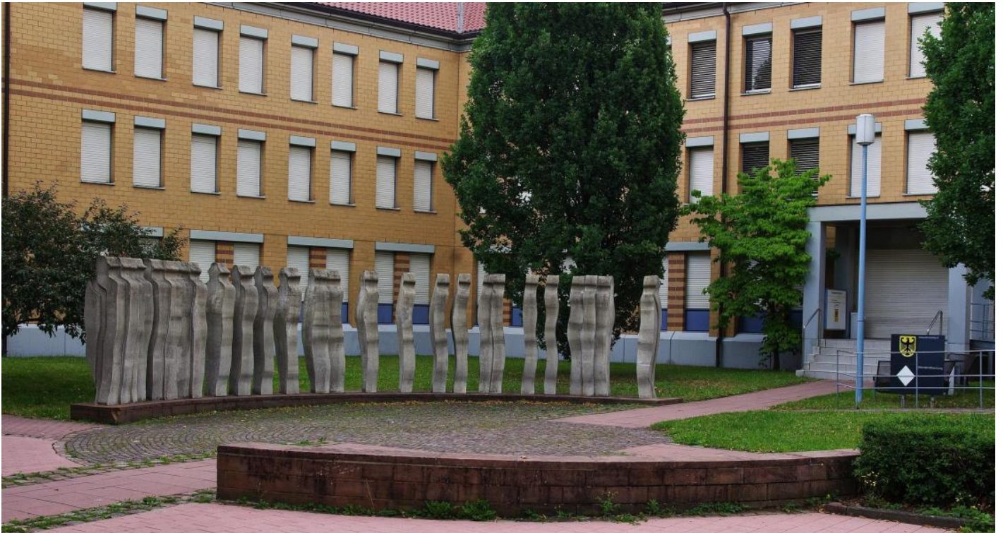
Rainer Stiefvater: Metamorphose, 1987