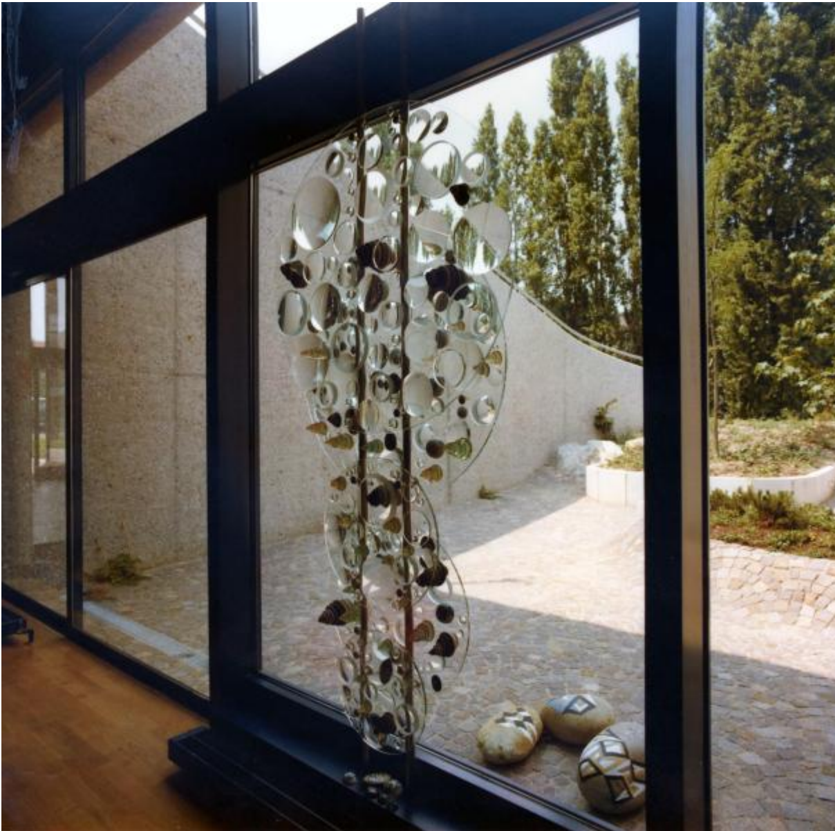
Mary Bauermeister: Linsenrelief und vier Linsenobjekte, 1979 / © VG Bild-Kunst, Bonn; Fotonachweis: Archiv BBR (1980)

Kunst am Bau im Auftrag des Bundes seit 1950