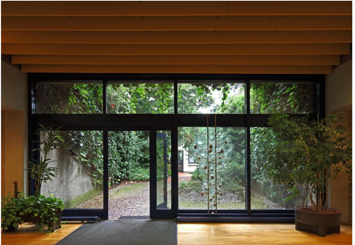
Mary Bauermeister: Linsenrelief und vier Linsenobjekte, 1979 / © VG Bild-Kunst, Bonn; Fotonachweis: BBR / Cordia Schlegelmilch (2013)

Kunst am Bau im Auftrag des Bundes seit 1950