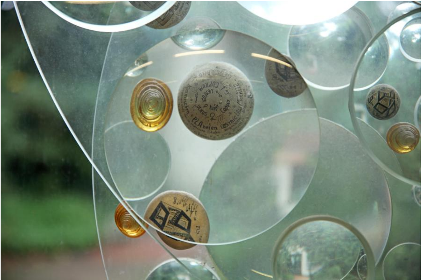
Mary Bauermeister: Linsenrelief und vier Linsenobjekte, 1979 / © VG Bild-Kunst, Bonn; Fotonachweis: BBR / Cordia Schlegelmilch (2013)