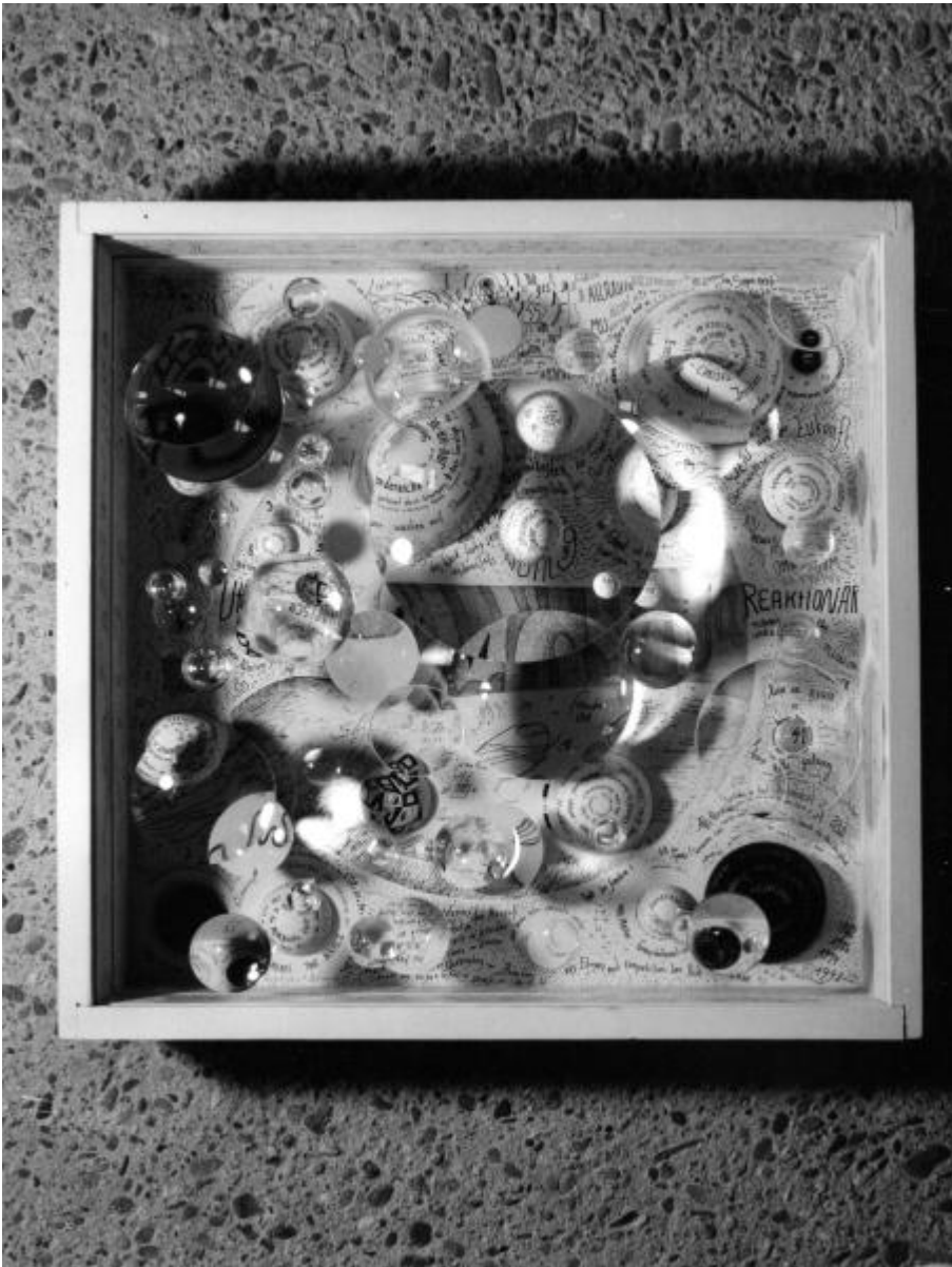
Mary Bauermeister: Linsenrelief und vier Linsenobjekte, 1979 / © VG Bild-Kunst, Bonn; Fotonachweis: Archiv BBR (1979)

Kunst am Bau im Auftrag des Bundes seit 1950