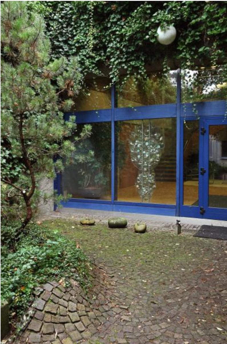
Mary Bauermeister: Linsenrelief und vier Linsenobjekte, 1979 / © VG Bild-Kunst, Bonn

Kunst am Bau im Auftrag des Bundes seit 1950