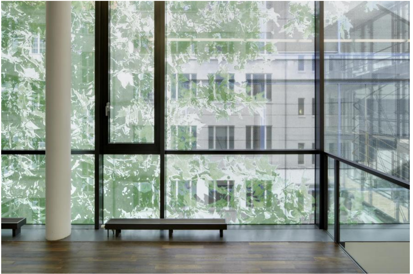
Veronika Kellndorfer: le regard extérieur / le regard intérieur, 2010 / © VG Bild-Kunst, Bonn

Kunst am Bau im Auftrag des Bundes seit 1950