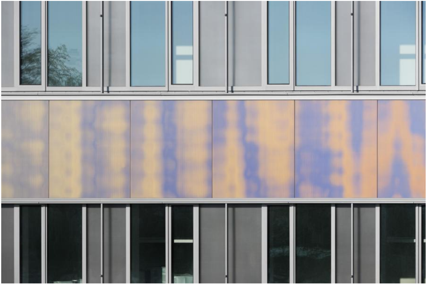
Katrin Agnes Klar: Komplementärspektrum, 2012 / © Katrin Agnes Klar

Kunst am Bau im Auftrag des Bundes seit 1950