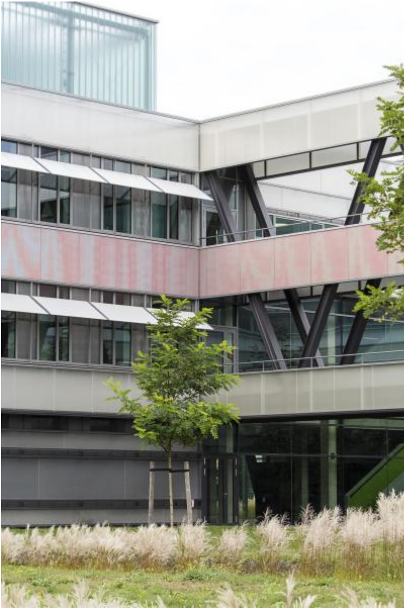
Katrin Agnes Klar: Komplementärspektrum, 2012 / © Katrin Agnes Klar; Fotonachweis: BBR / Cordia Schlegelmilch (2015)

Kunst am Bau im Auftrag des Bundes seit 1950