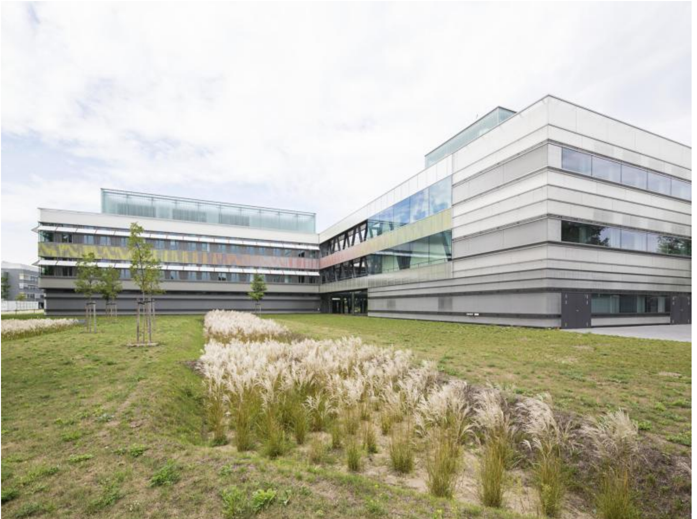
Katrin Agnes Klar: Komplementärspektrum, 2012 / © Katrin Agnes Klar