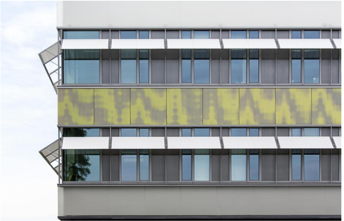
Katrin Agnes Klar: Komplementärspektrum, 2012 / © Katrin Agnes Klar; Fotonachweis: BBR / Cordia Schlegelmilch (2015)

Kunst am Bau im Auftrag des Bundes seit 1950