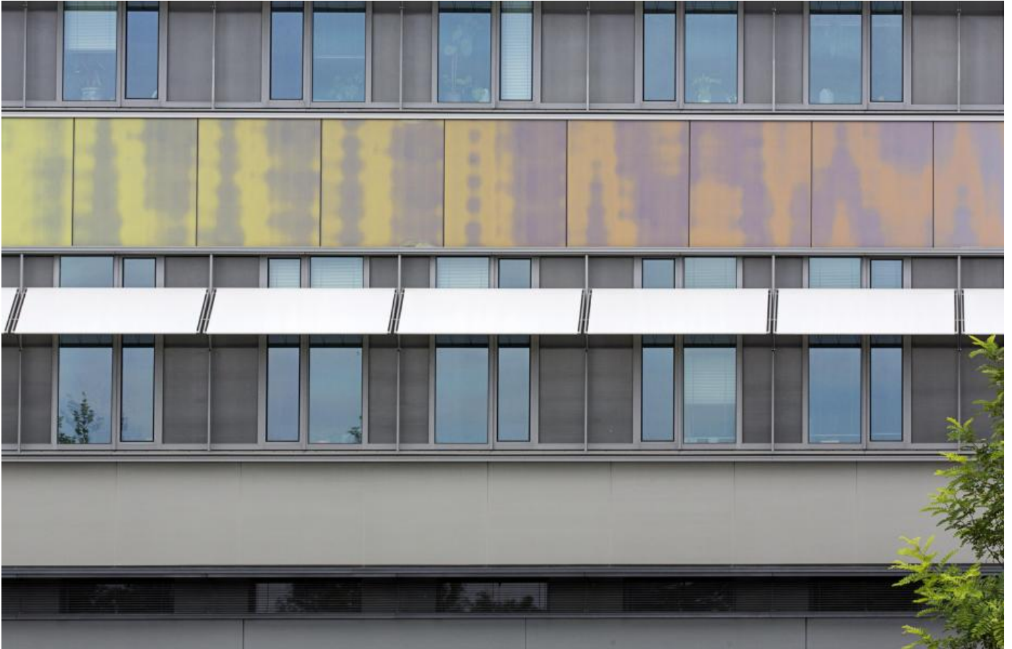
Katrin Agnes Klar: Komplementärspektrum, 2012 / © Katrin Agnes Klar; Fotonachweis: BBR / Cordia Schlegelmilch (2015)