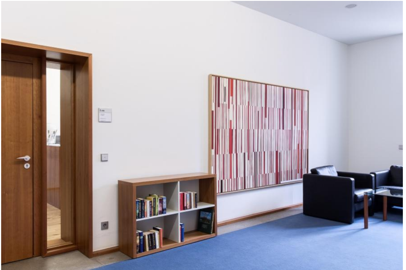
Carsten Nicolai: Information/Schlüssel, 1999 / © VG Bild-Kunst, Bonn; Fotonachweis: BBR / Cordia Schlegelmilch (2015)

Kunst am Bau im Auftrag des Bundes seit 1950