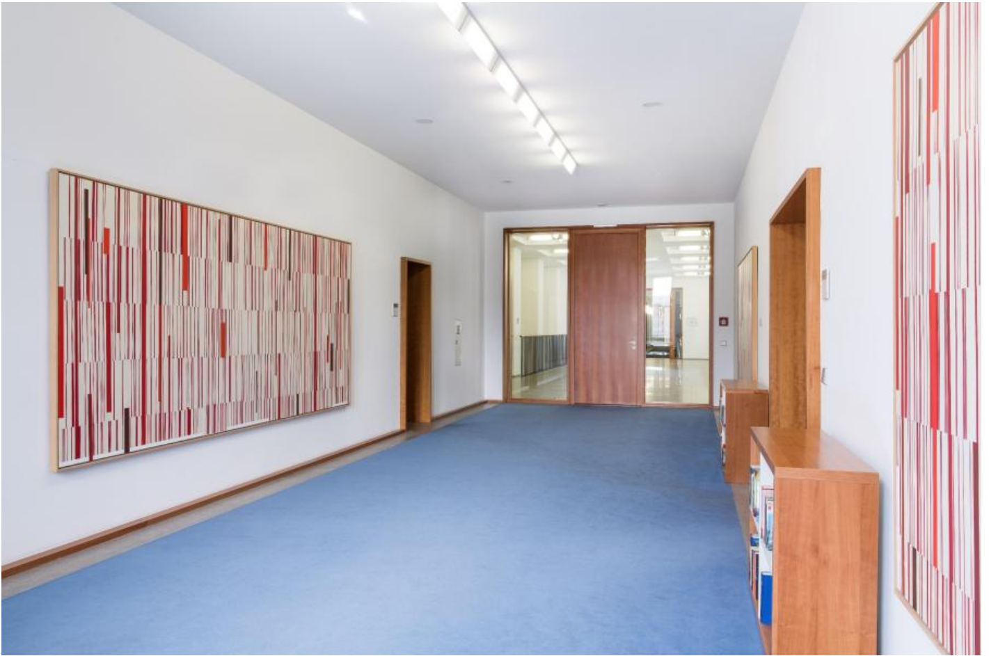
Carsten Nicolai: Information/Schlüssel, 1999 / © VG Bild-Kunst, Bonn; Fotonachweis: BBR / Cordia Schlegelmilch (2015)

Kunst am Bau im Auftrag des Bundes seit 1950