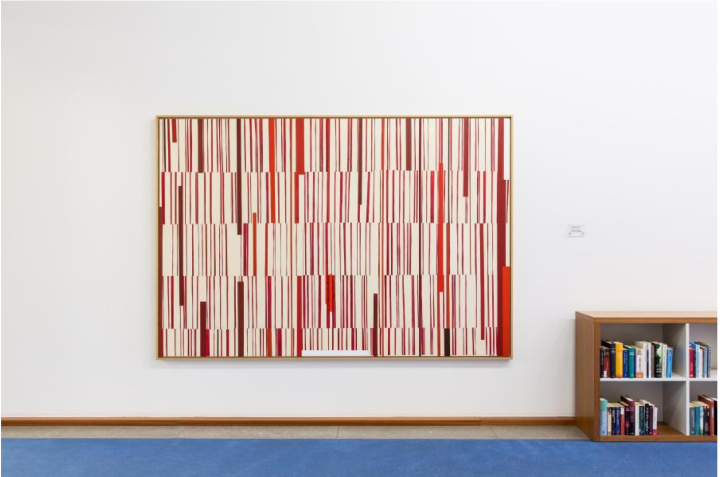
Carsten Nicolai: Information/Schlüssel, 1999 / © VG Bild-Kunst, Bonn