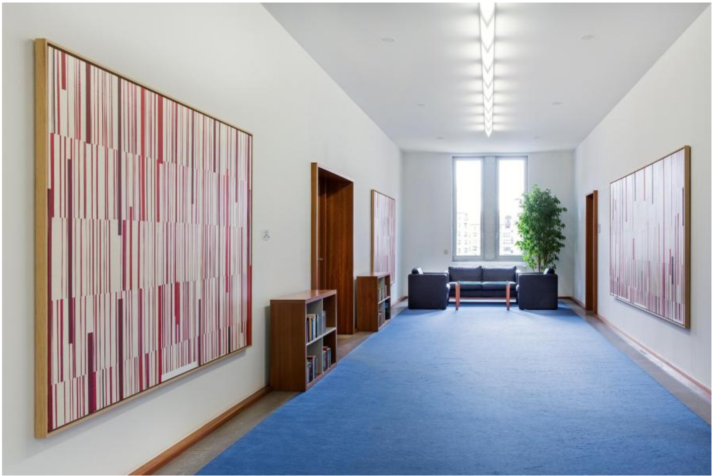
Carsten Nicolai: Information/Schlüssel, 1999 / © VG Bild-Kunst, Bonn; Fotonachweis: BBR / Cordia Schlegelmilch (2015)

Kunst am Bau im Auftrag des Bundes seit 1950