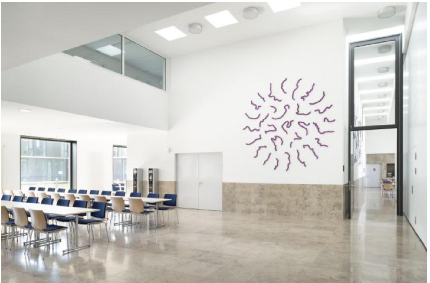
Matthias Geitel: Grenzen und Ereignisse, 2014 / © VG Bild-Kunst, Bonn

Kunst am Bau im Auftrag des Bundes seit 1950