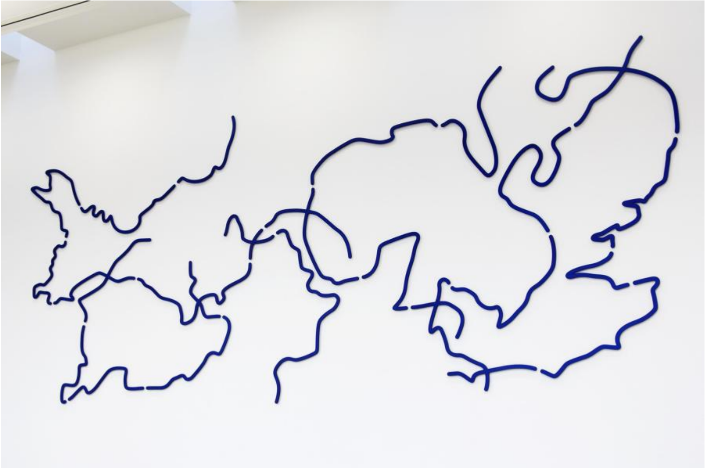
Matthias Geitel: Grenzen und Ereignisse, 2014 / © VG Bild-Kunst, Bonn