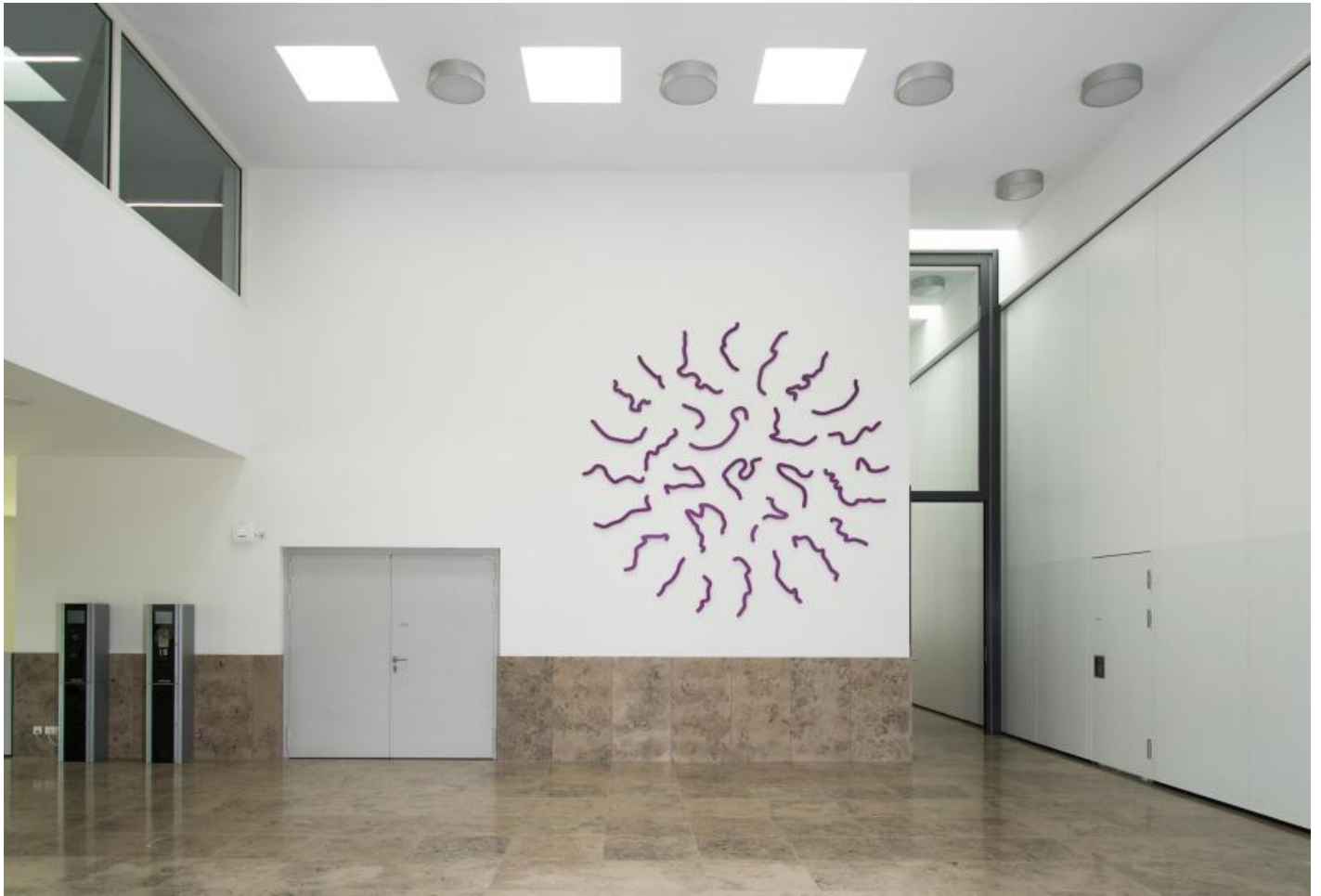
Matthias Geitel: Grenzen und Ereignisse, 2014 / © VG Bild-Kunst, Bonn; Fotonachweis: Matthias Geitel (2014)

Kunst am Bau im Auftrag des Bundes seit 1950