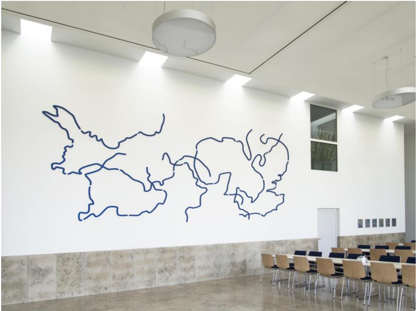
Matthias Geitel: Grenzen und Ereignisse, 2014 / © VG Bild-Kunst, Bonn; Fotonachweis: Matthias Geitel (2014)

Kunst am Bau im Auftrag des Bundes seit 1950