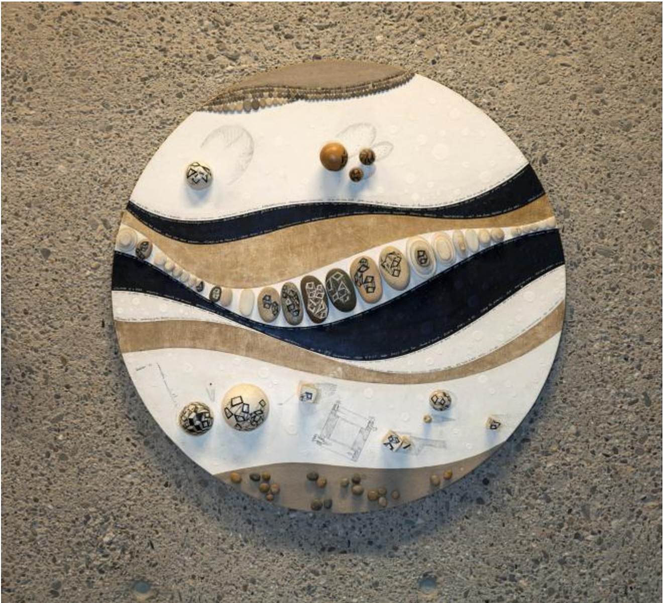
Mary Bauermeister: Fünf Steinobjekte, 1979 / © VG Bild-Kunst, Bonn; Fotonachweis: BBR / Cordia Schlegelmilch (2013)

Kunst am Bau im Auftrag des Bundes seit 1950