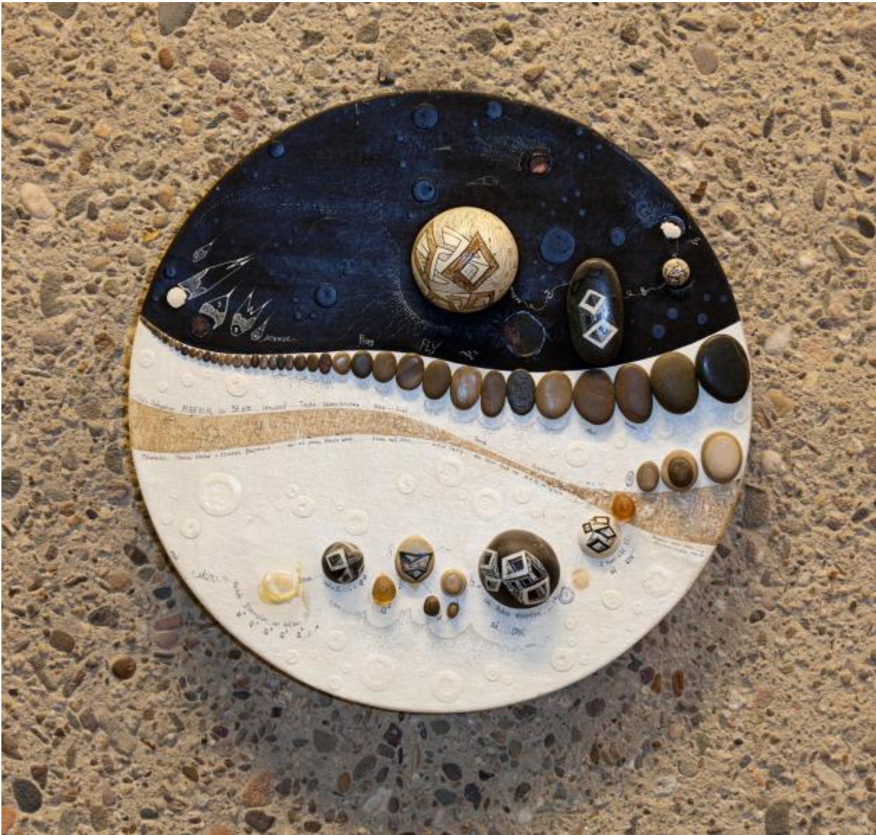
Mary Bauermeister: Fünf Steinobjekte, 1979 / © VG Bild-Kunst, Bonn

Kunst am Bau im Auftrag des Bundes seit 1950