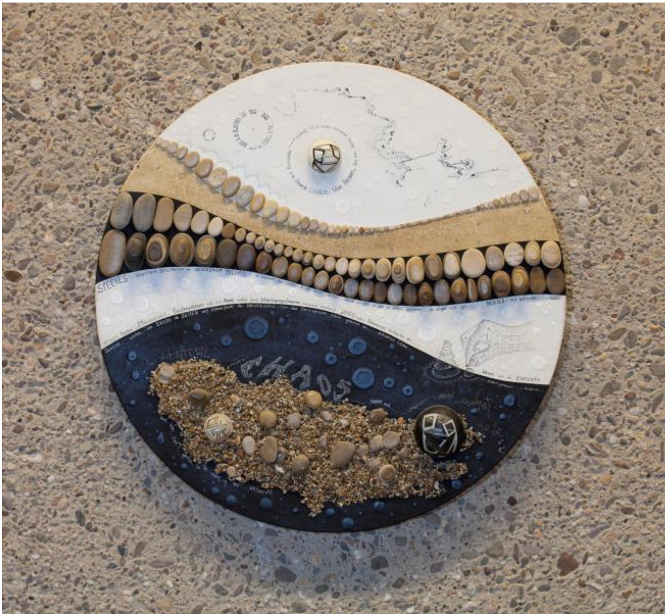
Mary Bauermeister: Fünf Steinobjekte, 1979 / © VG Bild-Kunst, Bonn; Fotonachweis: BBR / Cordia Schlegelmilch (2013)

Kunst am Bau im Auftrag des Bundes seit 1950