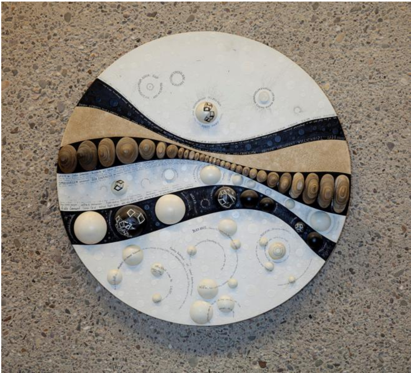
Mary Bauermeister: Fünf Steinobjekte, 1979 / © VG Bild-Kunst, Bonn; Fotonachweis: BBR / Cordia Schlegelmilch (2013)

Kunst am Bau im Auftrag des Bundes seit 1950