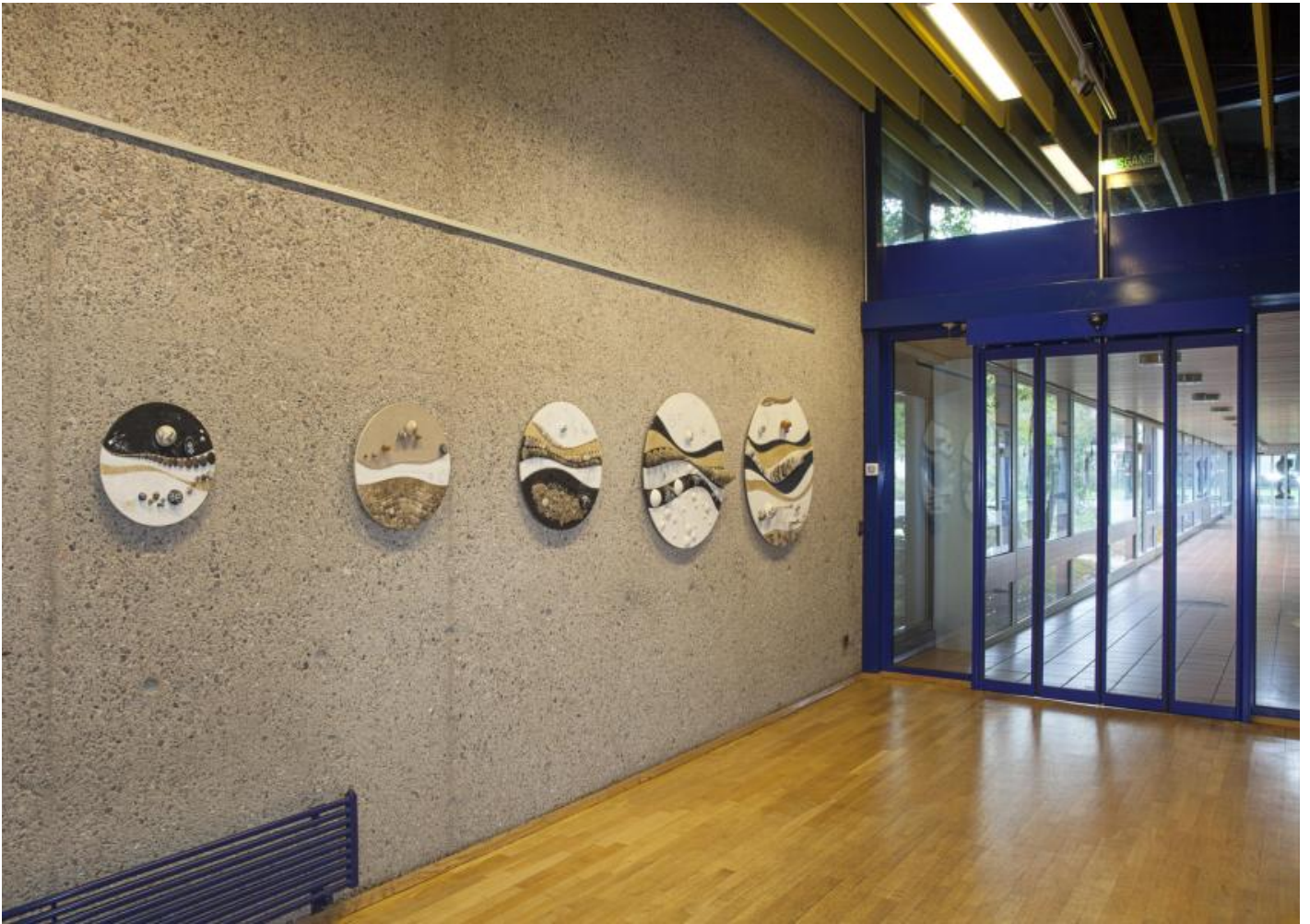
Mary Bauermeister: Fünf Steinobjekte, 1979 / © VG Bild-Kunst, Bonn; Fotonachweis: BBR / Cordia Schlegelmilch (2013)

Kunst am Bau im Auftrag des Bundes seit 1950