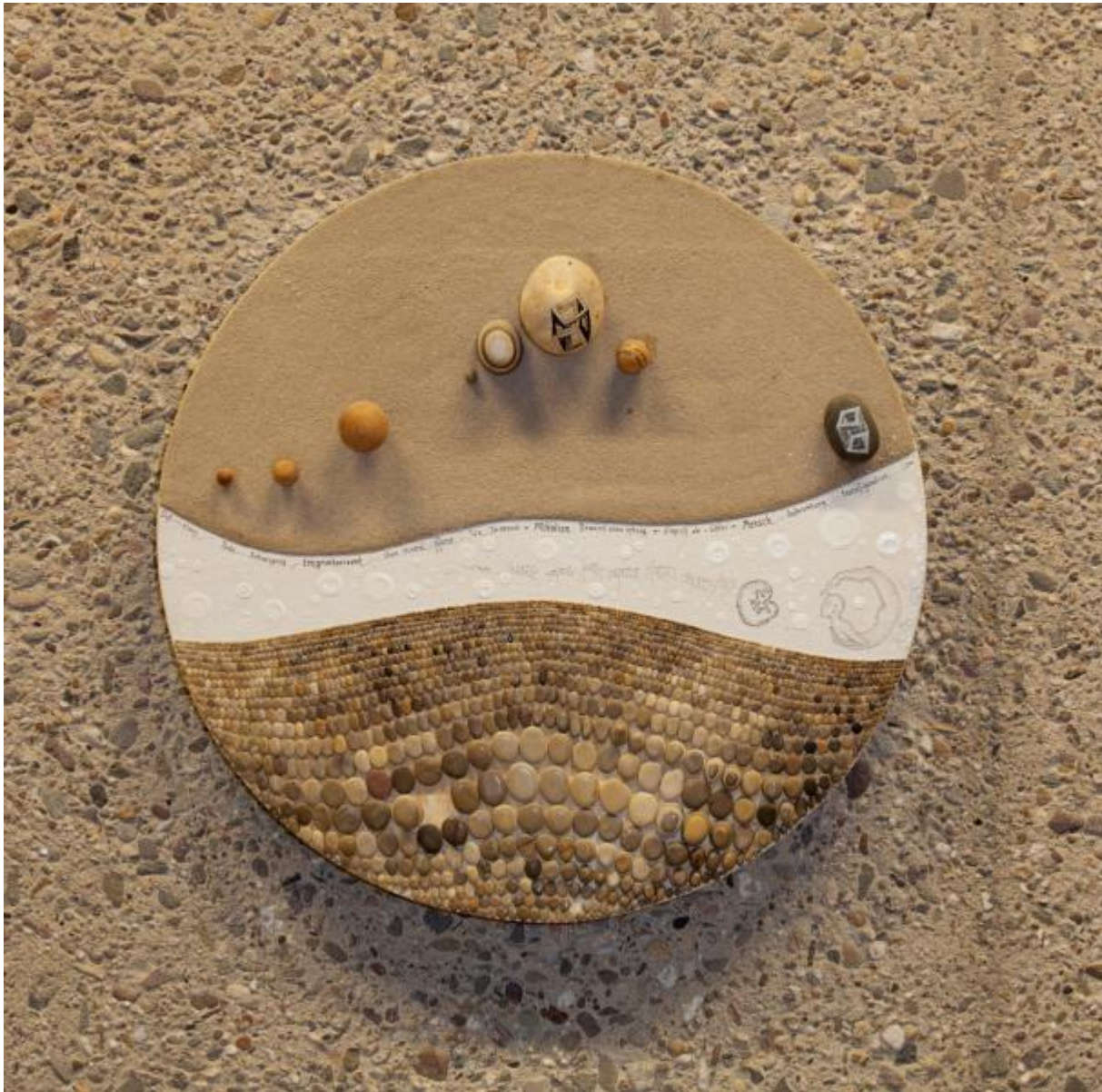
Mary Bauermeister: Fünf Steinobjekte, 1979 / © VG Bild-Kunst, Bonn; Fotonachweis: BBR / Cordia Schlegelmilch (2013)