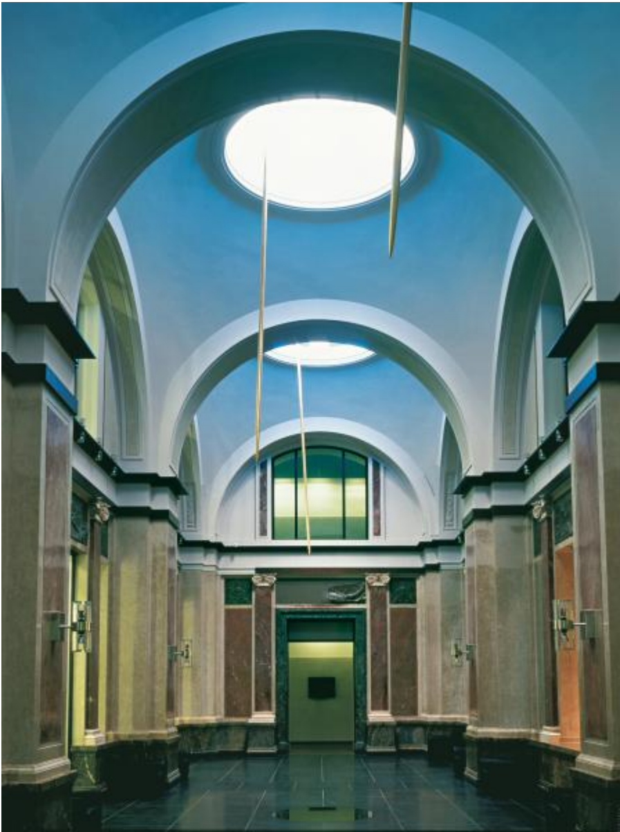
Rebecca Horn: Die drei Grazien, 2000

Kunst am Bau im Auftrag des Bundes seit 1950