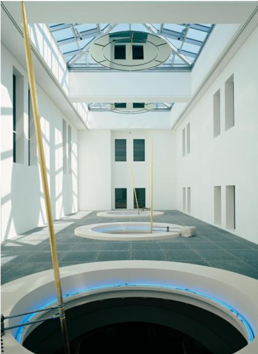
Rebecca Horn: Die drei Grazien, 2000 / © VG Bild-Kunst, Bonn; Fotonachweis: BBR / André Kirchner (2001)

Kunst am Bau im Auftrag des Bundes seit 1950