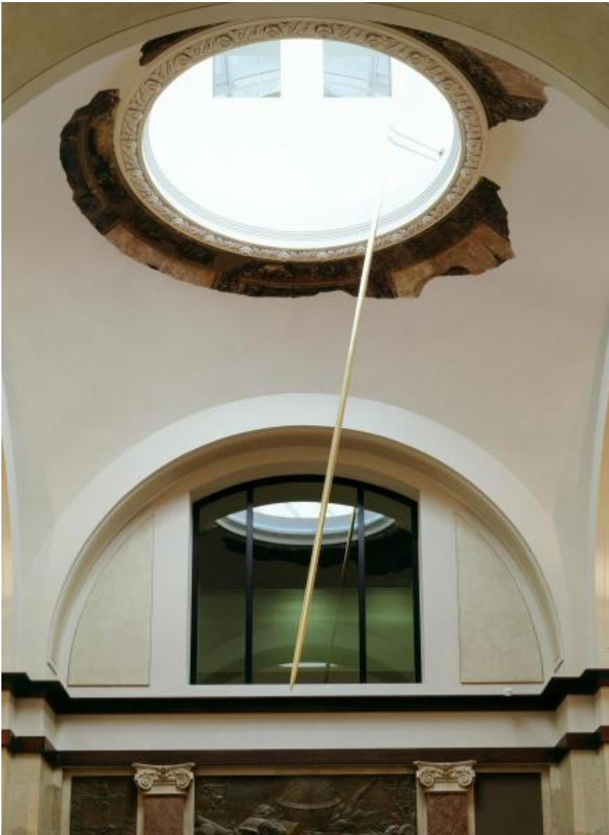
Rebecca Horn: Die drei Grazien, 2000 / © VG Bild-Kunst, Bonn; Fotonachweis: BBR / André Kirchner (2001)

Kunst am Bau im Auftrag des Bundes seit 1950