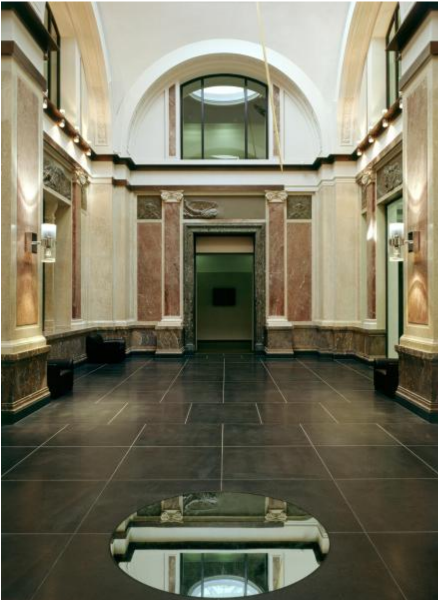
Rebecca Horn: Die drei Grazien, 2000 / © VG Bild-Kunst, Bonn

Kunst am Bau im Auftrag des Bundes seit 1950