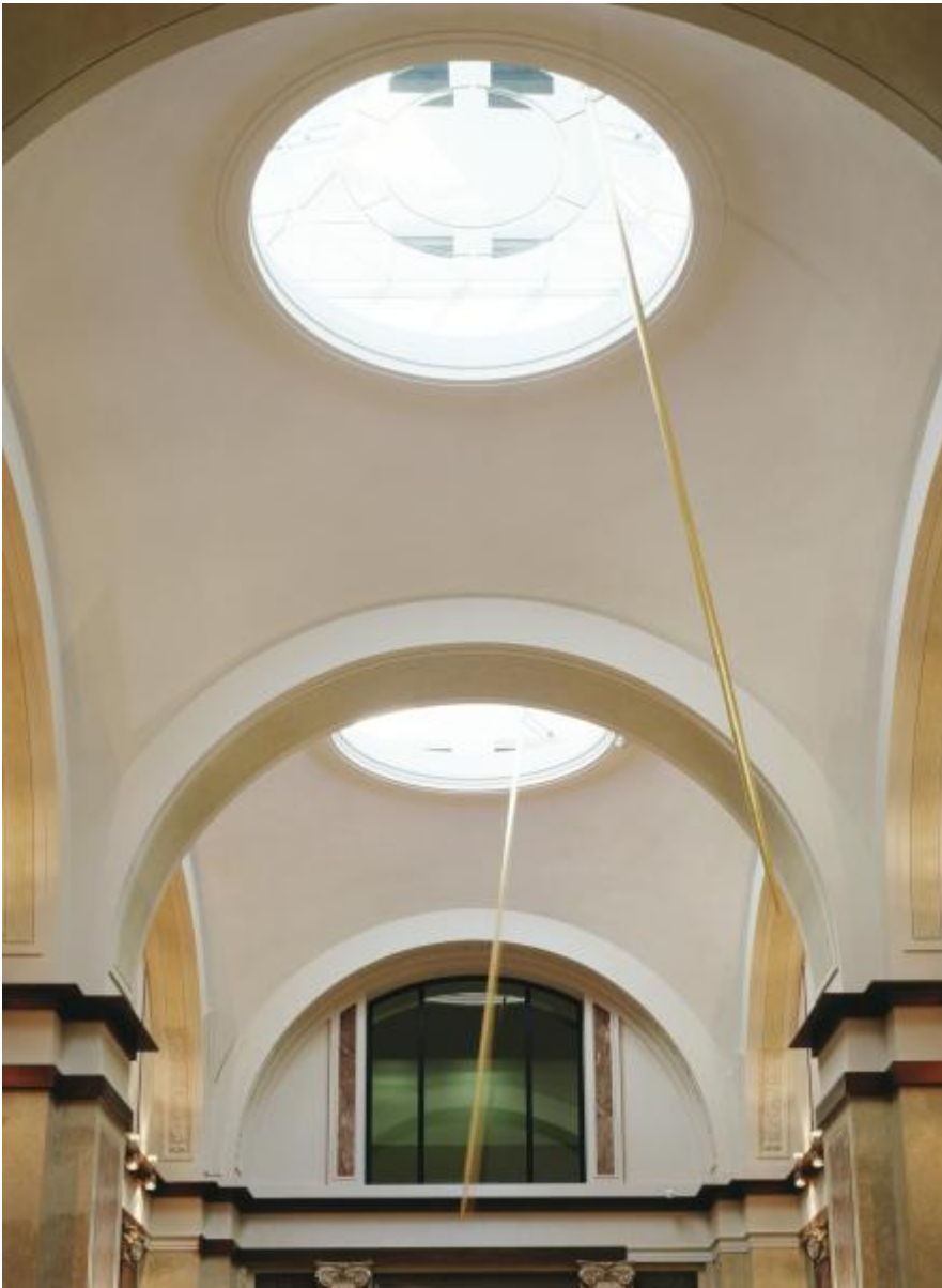
Rebecca Horn: Die drei Grazien, 2000 / © VG Bild-Kunst, Bonn

Kunst am Bau im Auftrag des Bundes seit 1950