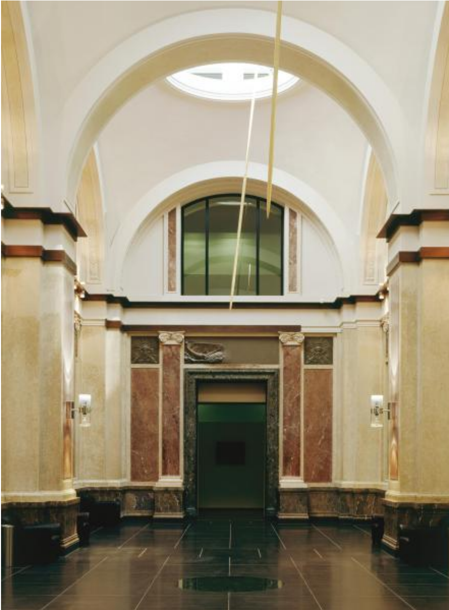
Rebecca Horn: Die drei Grazien, 2000 / © VG Bild-Kunst, Bonn; Fotonachweis: BBR / André Kirchner (2001)